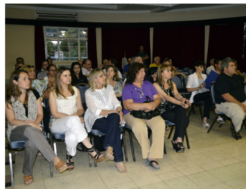
Firma de Convenio y reunión con vecinos del área

Se firmó el Convenio Específico de Asesoramiento y Asistencia Técnica entre la Universidad Nacional de Córdoba, Facultad de Arquitectura, Urbanismo y Diseño, y la Municipalidad para avalar la revalorización de la imagen del centro viejo de la ciudad.