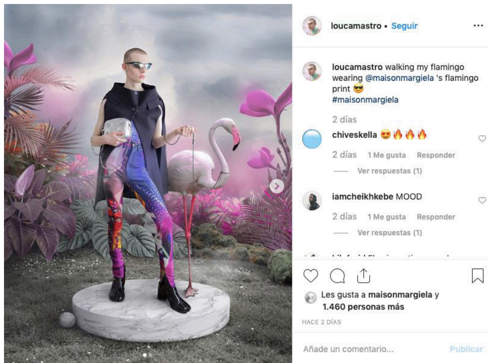
Imagen 2. Objetivo del post : potenciar el producto en Margiela