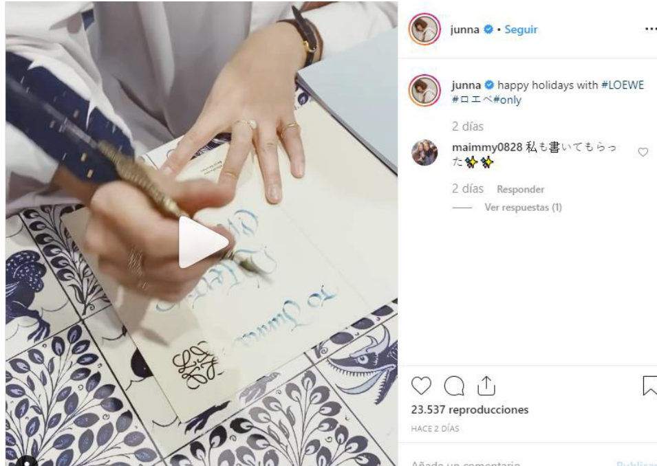
Imagen 1. Objetivo del post : potenciar la identidad de marca en Loewe

Como muestran los porcentajes de resultados (Tabla 3), los posts publicados se concentran en la promoción de la marca y del producto por delante del influencer . Destacan los mensajes dirigidos a reforzar la imagen de marca en Gucci (58.8%) y en Loewe (56,3%), mientras que en Margiela es el producto, el ítem, que concentra la máxima atención del post (80%).