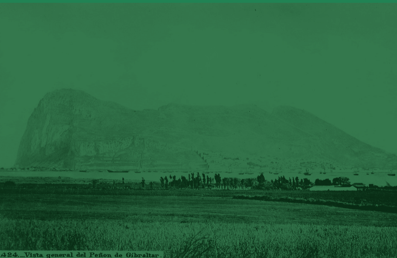
424._Vista general del Peñón de Gibraltar.

Revista Académica sobre la Controversia de Gibraltar Academic Journal about the Gibraltar Dispute