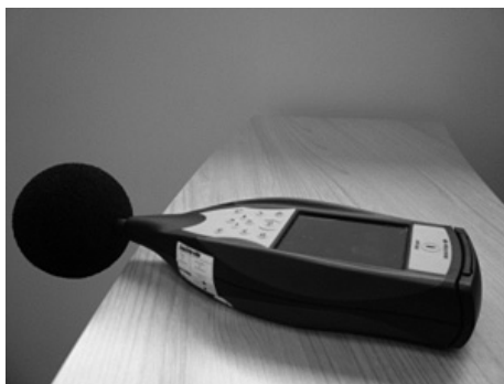
Figura 7. Equipos de medida do ruído: un sonómetro

cuxos integrantes sexan maiores de 16 anos, introduce os conceptos principais para coñecer a contaminación acústica, o oído humano e as características do son. Así mesmo, móstrase a instrumentación empregada para levar a cabo esta tarefa (Figura 7).