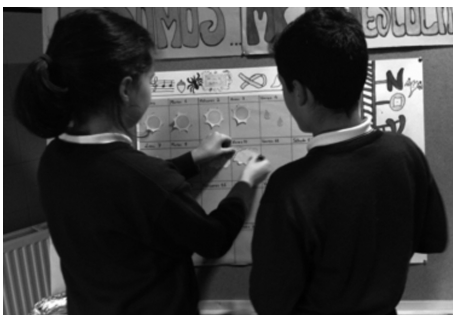
Figura 1. Taboleiro cos datos recollidos utilizando pictogramas (CPR Barreiro)

Ensinanza Secundaria: Elaboración de gráficos, estatísticas e climogramas (Lage, 2009), construción dunha caseta meteorolóxica; análises da relación entre meteoroloxía e arte, papel da meteoroloxía na música e/ou na Biblia, debates sobre películas relacionadas con fenómenos meteorolóxicos, difusión da predición meteorolóxica en distintos idiomas, elaboración de software que facilite a observación do tempo ou dé información sobre predición