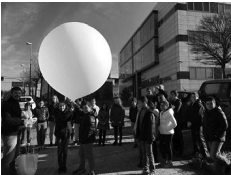
Figura 4. Lanzamento dunha radiosondaxe