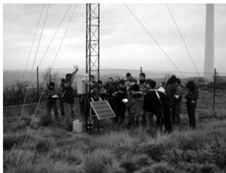
Figura 8. A estación meteorolóxica (EOAS) do Campus Sur da USC

E por último, a Consellería de Medio Ambiente e Ordenación do Territorio asinou tres convenios coas universidades galegas para recibir estudantes de grao, posgrao e máster. Durante os últimos anos, MeteoGalicia recibiu unha media de quin-