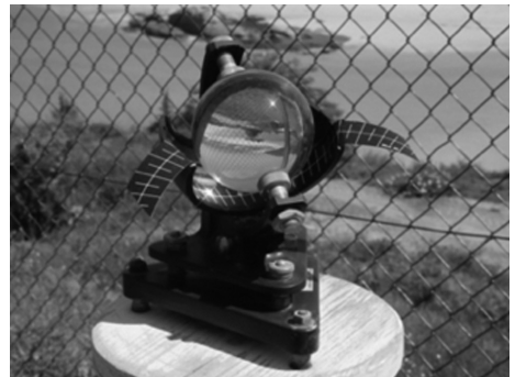
Figura 5. Aparellos meteorolóxicos: un heliógrafo