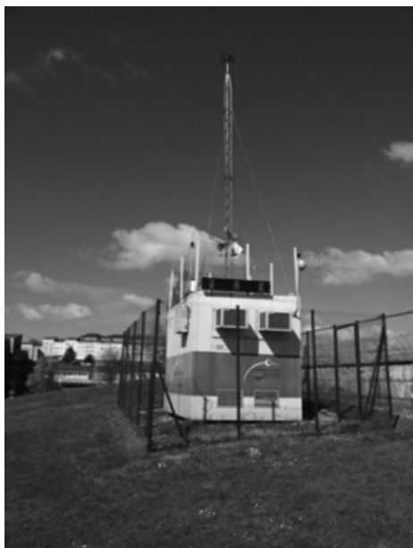
Figura 6. A estación de calidade do aire de San Lázaro

cuxos integrantes sexan maiores de 16 anos, introduce os conceptos principais para coñecer a contaminación acústica, o oído humano e as características do son. Así mesmo, móstrase a instrumentación empregada para levar a cabo esta tarefa (Figura 7).