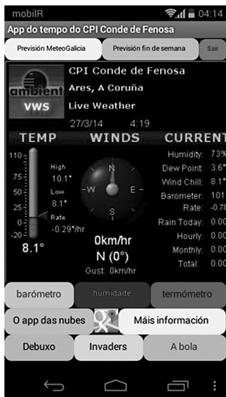
Figura 3. Creación dunha app para smartphones e tablets android onde se poden consultar en directo os datos da estación do centro (CPI Conde de Fenosa)

As actividades mencionadas anteriormente representan soamente unha parte moi pequena das que se levan a cabo no programa MeteoEscolas polos centros participantes desde que empezou funcionar este proxecto. MeteoGalicia premia o esforzo dos centros con novos instrumentos meteorolóxicos, que contribuirán á mellora