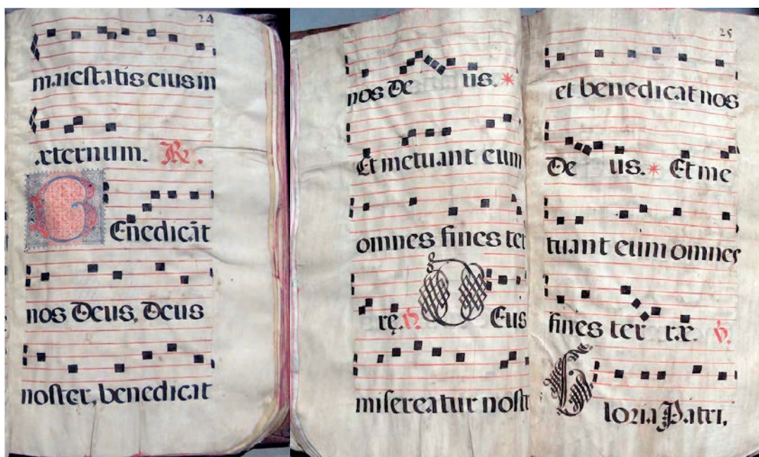
Figura 29.2: Tercer responsorio de los maitines para la Santísima Trinidad. Catedral Metropolitana de México, Libro de coro O21, fols. 24r-25r. R: cuerpo del responsorio; *: pressa ; V: verso (Foto: Silvia Salgado). Reproducido con autorización del Cabildo Catedral Metropolitano de México.

Donde el responsorio constituye un ítem aparte, sea breve o prolijo, es en los libros que contienen la música para los textos litúrgicos. Esa tradición que arranca desde la Edad Media se ve reflejada en los pocos libros de la Librería de cantorales de la Catedral de México que contienen responsorios en canto monódico. En la Figura 29.2 se observa el tercer responsorio de los maitines para la Santísima Trinidad, en el libro de coro O21 de la Catedral de México 24 , que es el mismo responsorio que se muestra en la Figura 29.1 tomada del breviario.