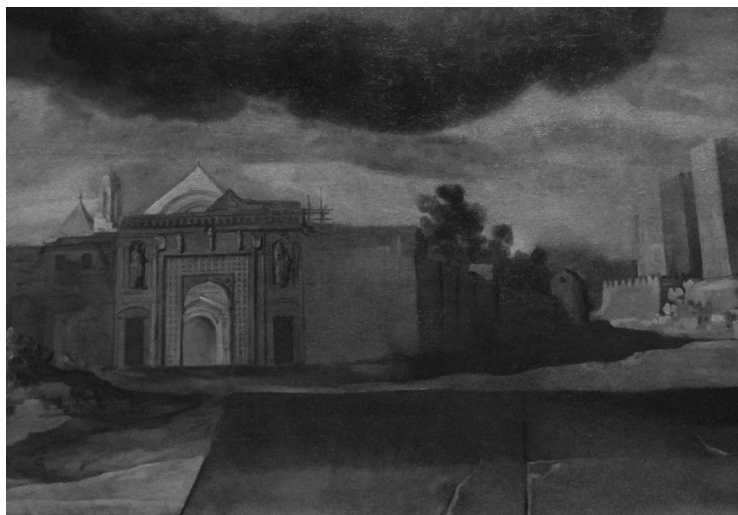
Fig. 3. Visión idealizada del convento de San Pablo, extramuros de la Villa, c. 1655. Entre el convento y la muralla se extiende la actual calle Capitulares (Antonio del Castillo, San Fernando presentando a San Pablo la fundación del convento de dominicos de Córdoba , detalle. Museo de Bellas Artes de Córdoba, CE2085P).

que se sucedieron durante la primera mitad del siglo xx fue tanto finalizar el nuevo ayuntamiento como conectarlo con el renovado centro urbano, prolongando hasta las Tendillas el trazado inicial de la calle Claudio Marcelo 36 (fig. 4).