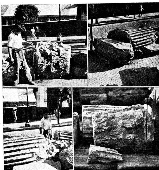
Fig. 6. Capiteles, fustes y basas hallados en las excavaciones (SANTOS, Memoria de las Excavaciones del Plan Nacional realizadas en Córdoba , 1955, Lám. XXI)