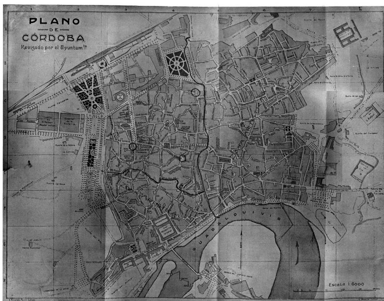
Fig. 2. Plano de Córdoba en el que se delimita el área declarada Zona Artística por la ro de 29 de julio de 1929 (TORMO, «Inclusión en el Tesoro Artístico Nacional de la parte vieja de la ciudad de Córdoba», 1929, s/p)

nueva declaración, solicitada conjuntamente por el Ayuntamiento y la CPM, fue aprobada por Real Oden de 29 de julio de 1929, tras informe favorable al expediente emitido por las Reales Academias de Bellas Artes y de la Historia. 17 La parte de la ciudad considerada intangible en 1912 quedaba convertida en Zona Artística 18 (fig. 2), y se fijaban para ella unas condiciones a las que debían ajustarse las edificaciones. Esto implicaba que cualquier obra que se quisiera realizar en esta área quedaba sometida a la supervisión de la CPM, que nombró como delegado ante la corporación municipal a E. Romero de Torres, sustituido posteriormente por una subcomisión. 19