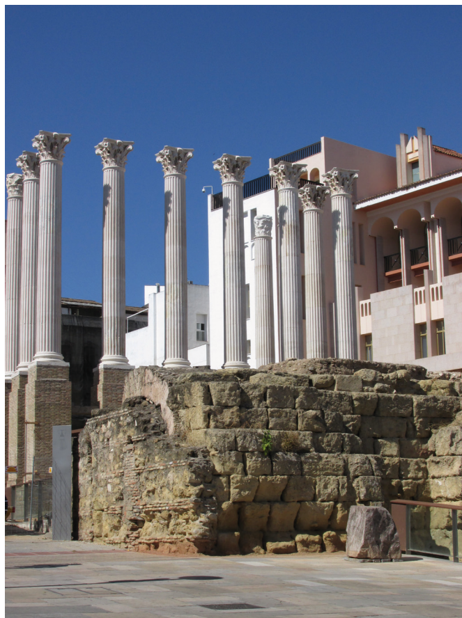
Fig. 8. Vista actual de la reconstrucción del pórtico del templo, diseñada por Félix Hernández junto al nuevo ayuntamiento de José Rebollo