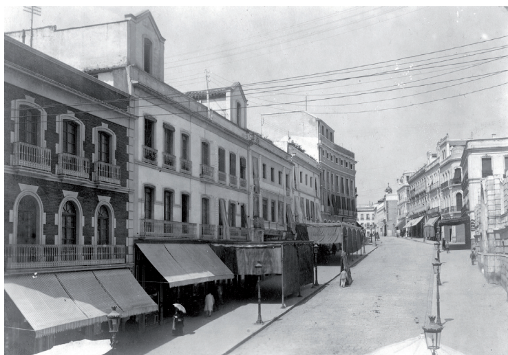
Fig. 4. Vista de la calle Claudio Macelo desde la calle Joaquín Costa, hoy Capitulares (1920). A la derecha, puede apreciarse el arranque de la inconclusa fachada meridional del ayuntamiento, y, al fondo, la plaza de las Tendillas (Archivo Municipal de Córdoba, FO/A 0186-005/F7-9).