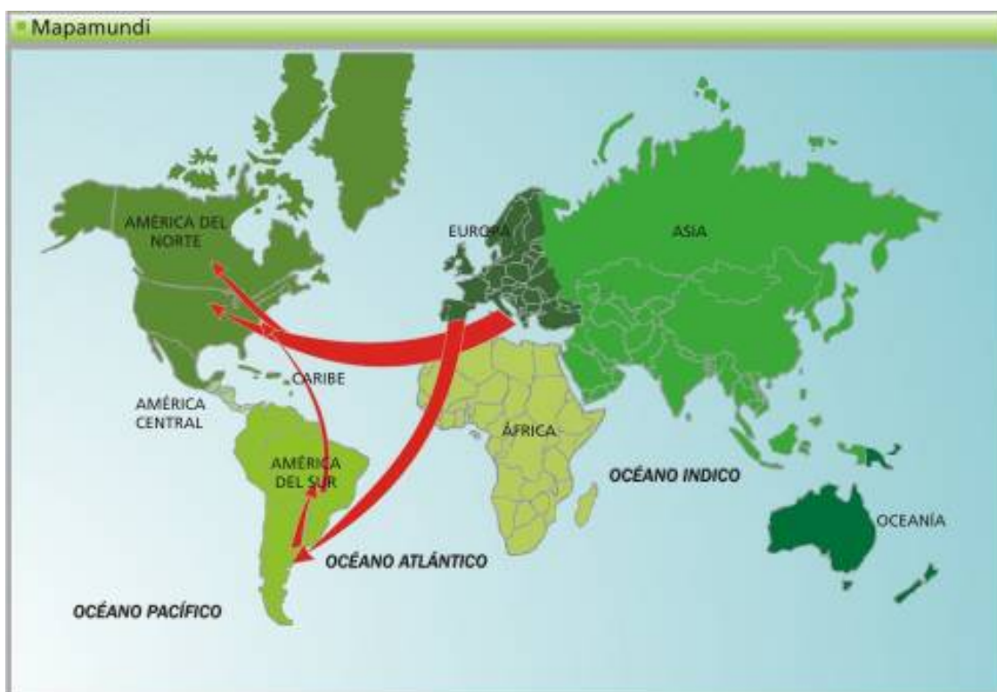
Ilustración 1: Principales flujos emigratorios europeos y destinos inmigratorios americanos en la primera ola global del Siglo XIX