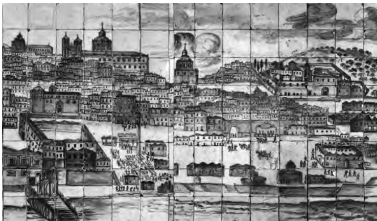
1 Pormenor da Ribeira Velha com o mercado, Vista panorâmica de Lisboa , Gabriel del Barco, 1698-99, Inv. MNAz 1 Az, Museu Nacional do Azulejo.

Numa leitura geral e preliminar, percebe-se que o primeiro aterro feito por D. Manuel foi extenso, permitindo ganhar algum espaço ao rio, sobretudo junto ao palácio dos Távoras, localizado na imediação da actual Rua do Cais de Santarém. As evidências que comprovam este aterro foram observadas em toda a área de escavação, bem como o cais mais antigo, também datado do século XVI, que teria início a este da Casa dos Bicos, prolongando-se na direcção de Alfama. As evidências arqueológicas sobre a vivência quotidiana deste espaço remetem-nos para actividades ligadas ao comércio marítimo e fluvial, através de zonas de embarque, desembarque e depósito provisório de madeiras, junto ao que seria o denominado cais de Santarém, bem como estaleiros de pequenas embarcações junto à Casa dos Bicos.