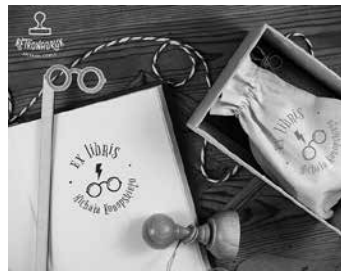
Fot. 5.

Mały symbol w różny sposób identyfikujący książkę (naklejka, stempel i tym podobne) niejednokrotnie bywa dziełem sztuki samym w sobie, podnosząc wartość kolekcjonerską egzemplarza. Ujawnia tożsamość właściciela – jego zainteresowania i wrażliwość na sztukę – styl epoki czy artyzm wykonawcy. Dostarcza wielu interesujących informacji zawartych w symbolicznej grafice. Wpisuje się także w tematykę pamięci pokoleń, które utrwały swoją obecność przez rękopiśmienne wpisy, odręczne dedykacje czy laudacje.