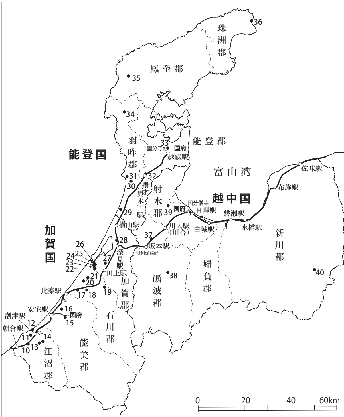
図2 加賀・能登・越中国の駅路と和同開珎出土遺跡

跡は、⑩敷地鉄橋遺跡、⑰宮丸遺跡、⑱末松廃寺跡、⑳千木ヤシキダ遺跡、㉓加茂遺跡であり、⑪宮地火葬墓遺跡や⑫篠原新遺跡、⑬高堂遺跡なども北陸道の近くに位置する。