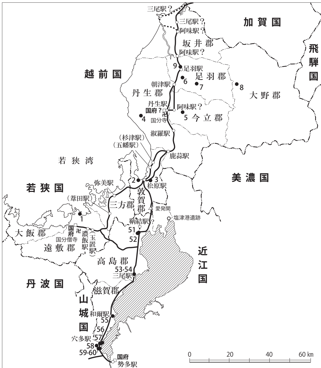
図1 近江・若狭・越前国の駅路と和同開珎出土遺跡

気比神宮に関する②③、初期荘園に関する⑥などが注目される。越前国府は丹生郡（現越前市）の日野川左岸に推定されているが、これまでに周辺からの和同開珎の出土は知られていない。