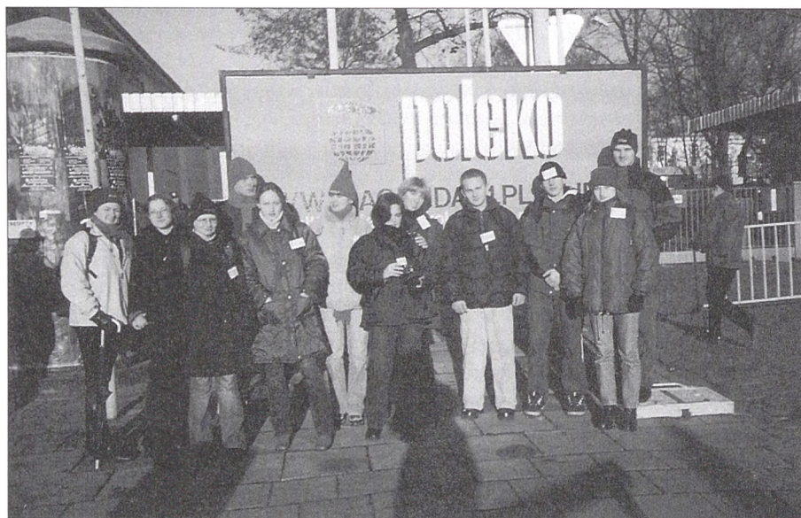
Fot. 3. Członkowie założyciele NKSOŚ UJ na targach „POLEKO” w Poznaniu (2002 r.)