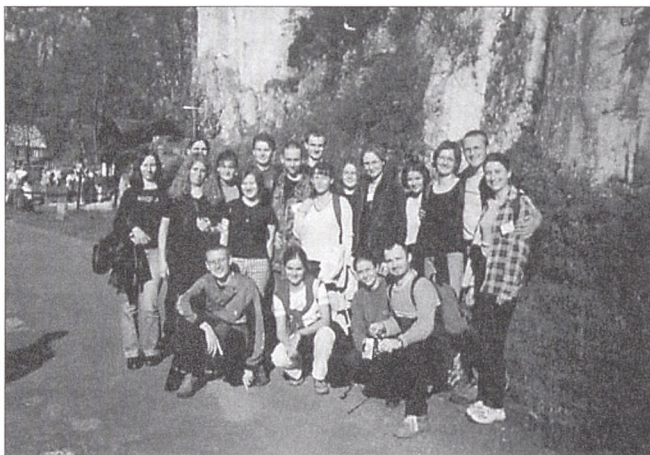
Fot. 2. Członkowie NKSOŚ UJ w Ojcowskim Parku Narodowym (2001 r.)