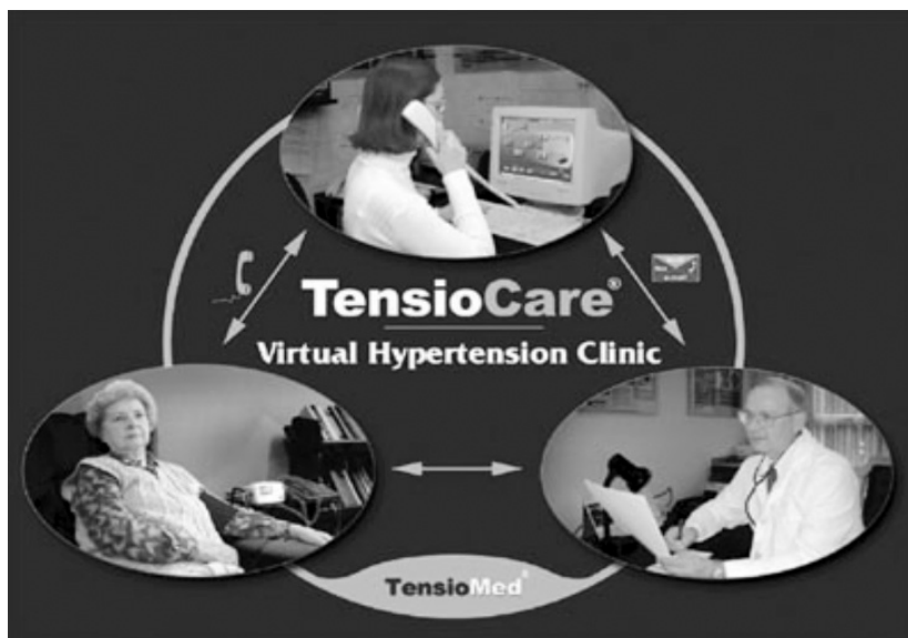
Rycina 2. System TensioCare działający w Budapeszcie

Aktualnie najbardziej rozpowszechnioną metodą rozpoznawania nadciśnienia tętniczego i monitorowania leczenia jest gabinetowy pomiar ciśnienia. Jednak jest on obciążony licznymi ograniczeniami i błędami wynikającymi z trudności w zachowaniu poprawnej metodyki i standardowych warunków pomiaru ciśnienia. Ponadto pomiar w gabinecie lekarskim bardzo często może być zafalszowany z powodu tak zwanego „efektu białego fartucha”, czyli nadmiernej reakcji pacjenta na kontakt z lekarzem. Poza tym pomiar gabinetowy nie zapewnia wglądu w zmienność ciśnienia tętniczego w ciągu doby [4] oraz w najmniejszym stopniu odzwierciedla rzeczywisty obraz choroby i pozostaje w najmniejszym związku z ryzykiem jej powikłań [5].