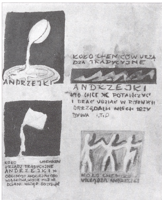
Fot. 1. Projekty plakatów zabawy andrzejkowej Koła Chemików nawiązujące do tradycyjnych wróżb: lanie wosku i ustawianie butów – panna, której but pierwszy przekroczy próg, wyjdzie wkrótce za mąż