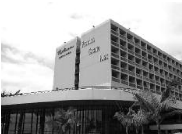
Ryc. 4. Widok na Pestana Casino Park Hotel, w którym odbyła się konferencja.

Konferencja odbyła się w Pestana Casino Park Hotel (ryc. 4), budynku zaprojektowanym przez znanego brazylijskiego architekta Oscara Niemeyera, położonym nad oceanem, nieopodal centrum Funchal. W konferencji wzięło udział ponad 1600 uczestników z ponad 100 krajów. Streszczenia prac zostały wydane w formie dysku CD – zajmują bowiem 1126 stron!