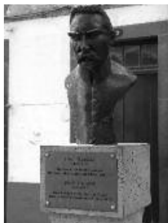
Ryc. 2. Popiersie Marszałka Józefa Piłsudskiego.