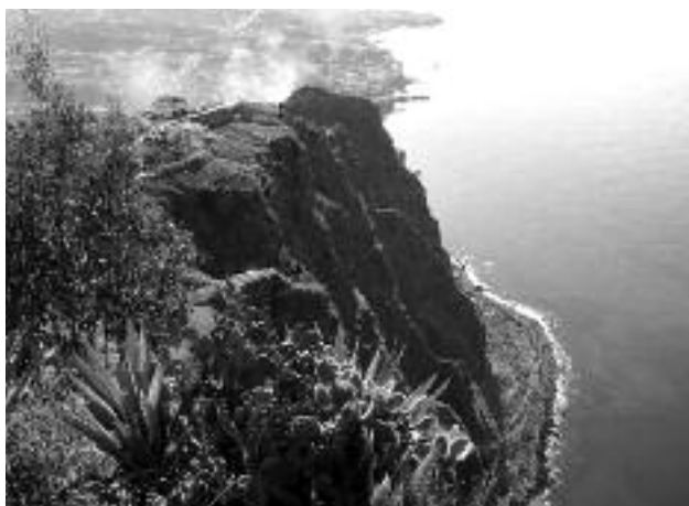
Ryc. 3. Widok z klifu Gabo Giro.

n.p.m. (ryc. 3), unikatowymi lasami wawrzynowymi i naturalnymi basenami wulkanicznymi.