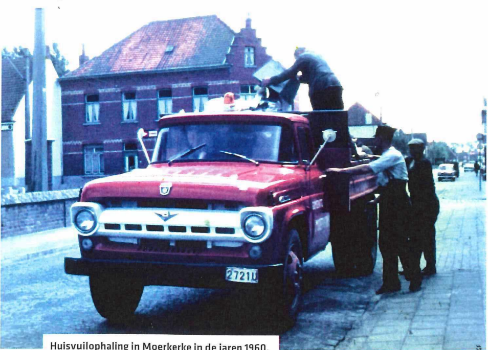
Huishuifophaling in Moerkerke in de jaren 1960.