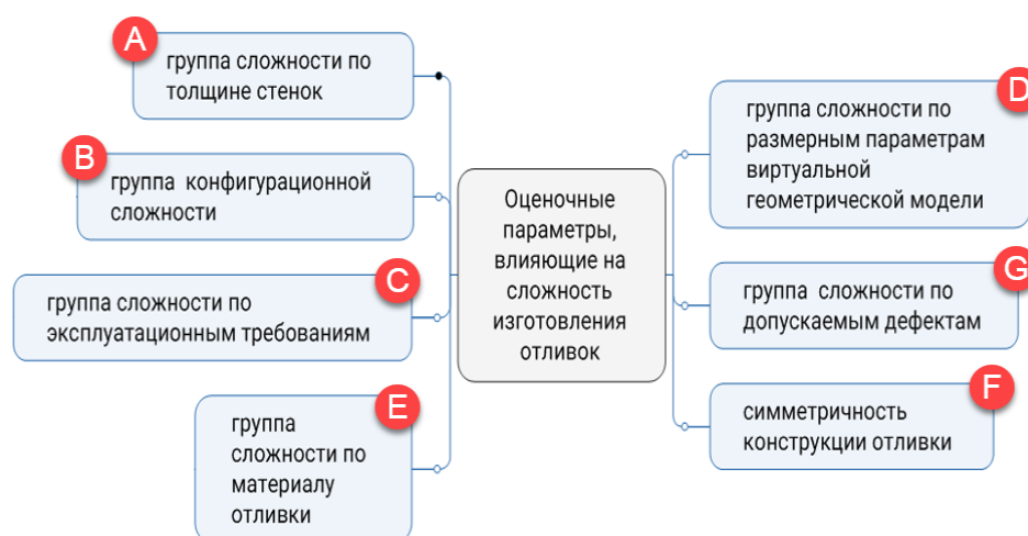
Рис. 1. Группы параметров оценки технологической сложности отливки/литейной технологии

Для построения классификатора технологической сложности необходимо определить, какие параметры (рис. 1) влияют на принятие решения о том, к какому классу принадлежит образец. Для оценки технологической сложности изготовления отливок предлагается методика с выделением следующих групп оценочных параметров, влияющих на технологические параметры и сложность изготовления.