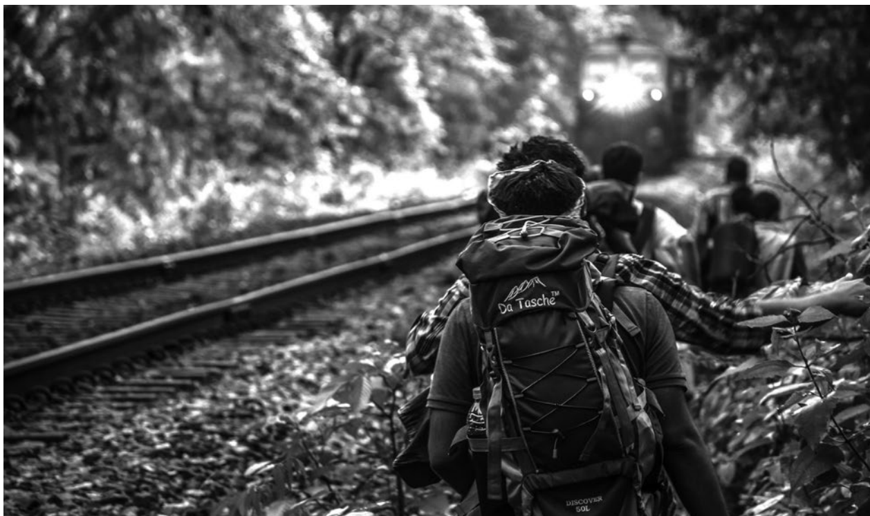
Original a color.