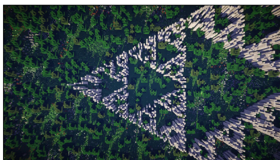
Figura 6. Triángulo de Sierpinski.

Este pequeño ejemplo muestra cómo, mediante el uso de unas pocas instrucciones que forman la base de toda la API de Minecraft, pueden generarse estructuras que llevarían mucho tiempo construir a mano. Por una cuestión de espacio, sólo se incluyó el código para construir una estructura relativamente simple como es una muralla, pero otras estructuras más complejas también son posibles. Por ejemplo, fractales como el triángulo de Sierpinski (Figura 6) o la curva del dragón (Figura 7).