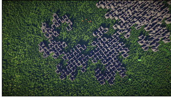
Figura 7. La curva del dragón.

Todos estos ejemplos vienen preinstalados en la API para que los jugadores puedan tomarlos como referencia y desarrollar sus propias estructuras. Por supuesto, todo el código que compone a la API es de código abierto. En el caso del código del juego, si bien el Minecraft original fue decompilado y modificado el objetivo no es exponer al jugador a ese código sino en su lugar portar la mayor parte al módulo en Squeak. De esta forma, el usuario tendrá una única interfaz de programación homogénea que ver, modificar, y extender.