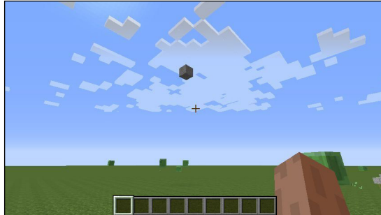
Figura 1. Creación de un bloque.

examples block: #stone at: player position + 10