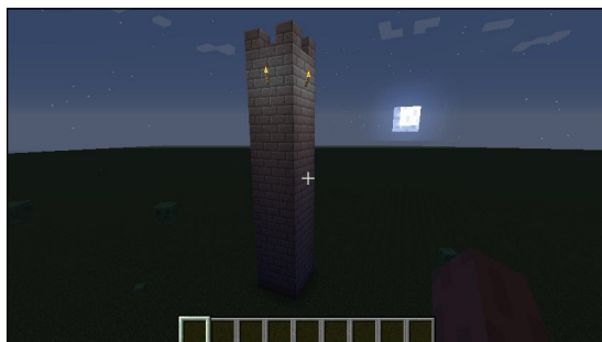
Figura 4. Resultado de la construcción de la torre de ladrillos.

at: point + (-1 @ height @ 1). self block: #stonebrick at: point + (1 @ height @ -1). self block: #stonebrick at: point + (1 @ height @ 1). self block: #torch at: point + (-2 @ (height - 2) @ 0). self block: #torch at: point + (2 @ (height - 2) @ 0). self block: #torch at: point + (0 @ (height - 2) @ -2). self block: #torch at: point + (0 @ (height - 2) @ 2)