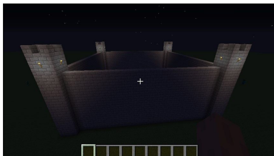
Figura 5. Construcción de un castillo utilizando los métodos anteriores.

from: point1 to: (point1 x @ (point1 y + wallHeight) @ point2 z). self blocks: #stonebrick from: point1 to: (point2 x @ (point1 y +wallHeight) @ point1 z). self blocks: #stonebrick from: (point1 x @ point1 y @ point2 z) to: point2 + (0 @ wallHeight @ 0). self blocks: #stonebrick from: (point2 x @ point1 y @ point1 z) to: point2 + (0 @ wallHeight @ 0).