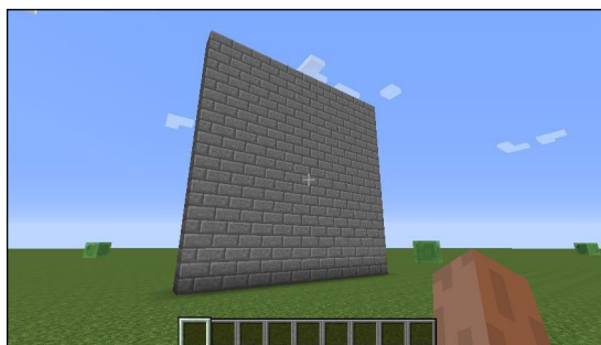
Figura 2. Una pared de 10 por 10 ladrillos en una posición relativa al jugador.

examples wall: #stonebrick at: player position - (0 @ 0 @ 10) width: 10 height: 10.