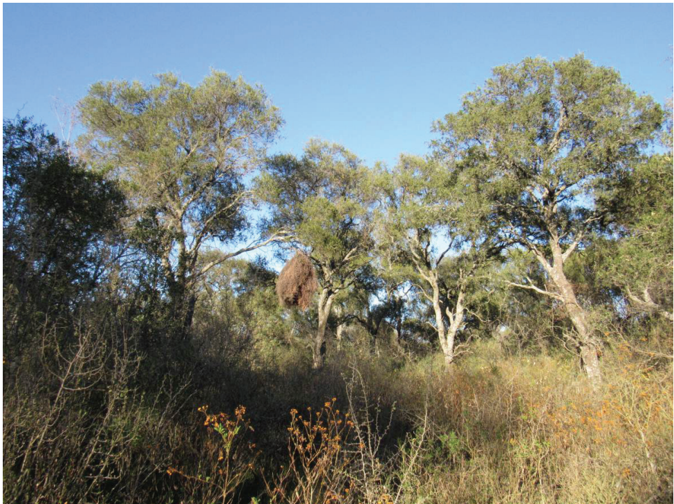
Figura 2. Imagen del interior del área de estudio, en la provincia fitogeográfica del Espinal, Argentina, en la cual se puede observar algunos ejemplares de quebracho blanco ( Aspidosperma quebracho-blanco ), y un denso sotobosque compuesto por diversas especies arbustivas y herbáceas.

Para obtener una lista de especies de la manera más completa posible se usó una combinación de tres métodos diferentes. Se realizaron puntos de conteo y conteos en transectas a lo largo de tres temporadas de primavera-verano: 2011–12, 2012–13 y 2016 y tres temporadas de invierno: 2012, 2013 y 2016. En tanto, se llevaron a cabo registros no sistemáticos en ambas temporadas entre los años 2011 y 2018. 1) Puntos de conteo : se registraron visual y auditivamente todos los individuos de las distintas especies presentes en un radio fijo de 50m durante un lapso de 10 minutos. En total se realizaron 63 puntos de conteo (47 durante la temporada primavera-verano y 16 durante la temporada de invierno), los cuales se distribuyeron de manera aleatoria a lo largo de todo el sitio de estudio mediante el uso del programa ArcGis con una separación mínima entre puntos de 100m. En total se sumaron 10 horas y 50 minutos de observación. Estos muestreos se realizaron durante las primeras cuatro horas posteriores al amanecer y durante las últimas tres horas previas al anochecer. 2) Transectas : se registraron las especies vistas y oídas durante recorridos a través de distintos sectores del área, los cuales se realizaron tanto por el interior como por el borde del sitio (colindante con la matriz de cultivo).