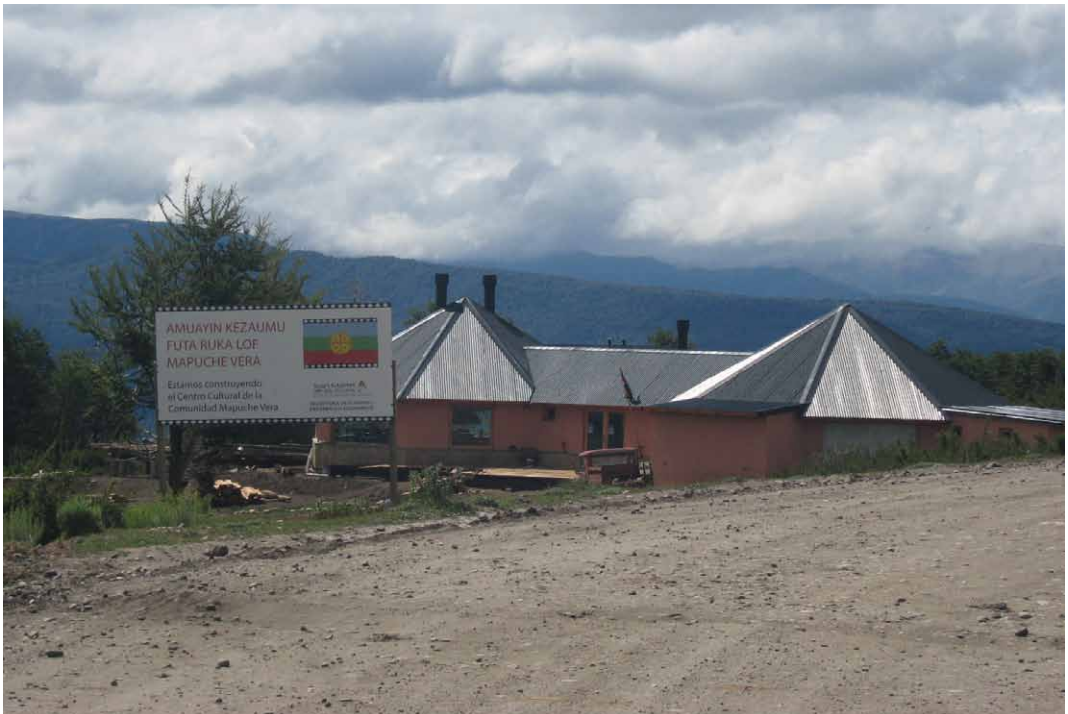
Enero 2013.