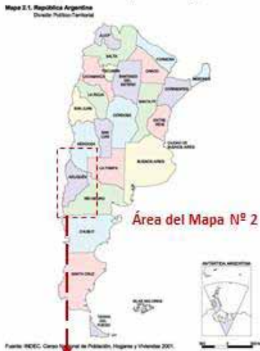
Mapa N° 1: República Argentina