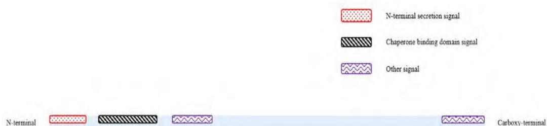
图 2 分泌信号示意图

与依赖信号肽分泌途径形成鲜明的对比，蛋白通过细菌三型分泌系统分泌或者转运时，没有可识别的保守信号序列。所分泌的效应蛋白不在胞浆间隙中停留，也不被切割，直接从胞质输送到细胞表面 [26] 。细菌三型分泌系统分泌蛋白的分泌信号不依赖于信号肽，那么这些蛋白是如何靶向细菌三型分泌系统的？或者它们的分泌信号序列又是什么呢？早在 1997 年就有研究者提出了耶尔森氏菌中三型分泌系统分泌效应蛋白的两种独立分泌信号假说，即效应蛋白拥有至少两个独特的区域引导其到达分泌装置处 [27] 。第一个区域位于氨基末端约前 20 个氨基酸，即氨基末端分泌信号(N-terminal secretion signal, NSS)，第二个区域位于约前 140 个氨基酸，即伴侣蛋白结合区域信号(Chaperone binding domain, CBD)，这两种分泌信号可以独立的行使功能并能够互相促进 [27] 。如图 2 所示。