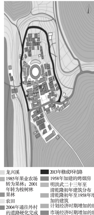
图5 市场经济时期王都坂的形态分布

在小农经济与计划经济时期,由于地理位置相对闭塞,王都坂与外界的交流一直较少。直至市场经济时期,村民与外界交流的机会增加,但王都坂大多数村民的人际关系圈都局限于村内。即使修了道路,王都坂的外来人口依然较少,外界环境对其的影响也相对较小。