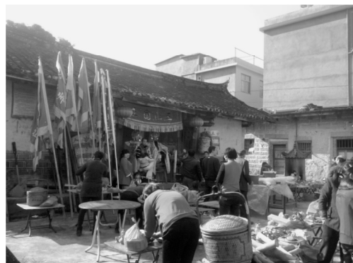
图10 年尾福巳时拜“三山国王”

龙兴庙请来“三山国王”神像,置于祖厝门前接受村民的祭拜。村里各户在祖厝前的空地,面朝祖厝摆齐自家的祭祀贡品,并由乡贤主持祭拜“三山国王”(见图10)。祭拜结束后,村民依次上前向“三山国王”神像进香,直至仪式结束。