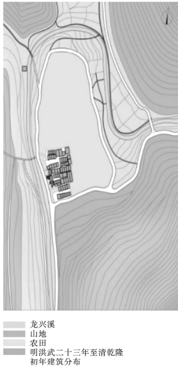
图3 小农经济时期王都坂的形态分布

织系统的开放性得到加强。这一时期外界社会的信息、技术、文化大量涌入乡村,使得乡村的面貌产生了较大的改变。到了20世纪90年代,随着经济条件逐渐好转,陶淑楼的东边和北边的空地也开始被村民用于建造住宅。如今,王都坂环村路内的空地绝大多数都被占用以建造村民住宅。