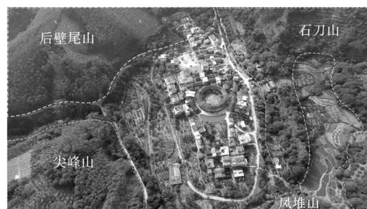
图1 王都坂的自然环境

王都坂的地形以山地丘陵为主,地势南高北低,濒临龙兴溪,地形起伏变化较小。村内山体多为火山岩,厚度巨大。村东面为尖峰山,西面为石刀山,南面为后壁尾山,北面为凤堆山。村落东面、西面、北面皆为龙兴溪环绕(见图1)。