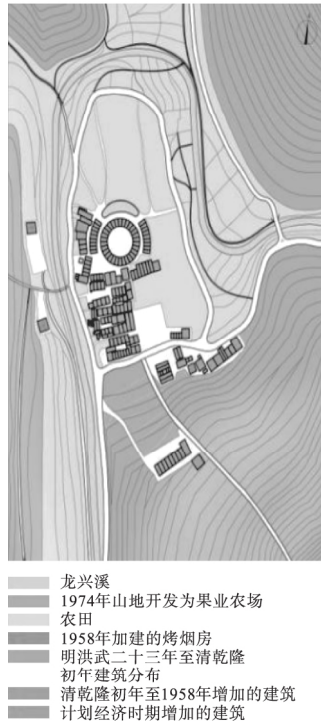
图4 计划经济时期王都坂的形态分布