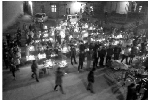
图9 年尾福子时拜天地

龙兴庙请来“三山国王”神像,置于祖厝门前接受村民的祭拜。村里各户在祖厝前的空地,面朝祖厝摆齐自家的祭祀贡品,并由乡贤主持祭拜“三山国王”(见图10)。祭拜结束后,村民依次上前向“三山国王”神像进香,直至仪式结束。