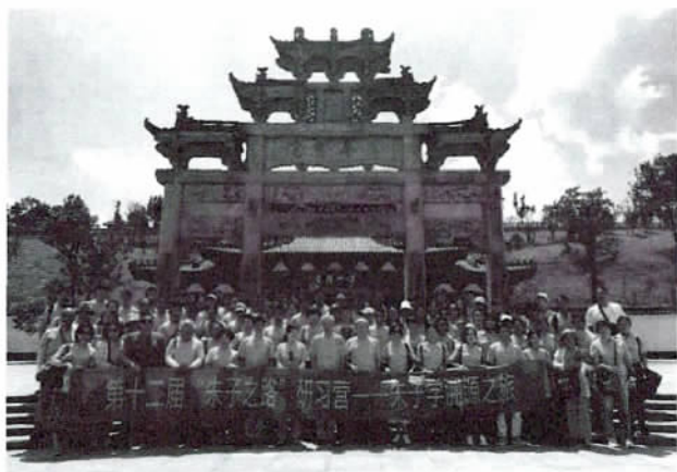
建阳考亭书院石牌坊合影

帝赵昀御书匾额褒崇之。考亭书院因年湮代远风雨侵蚀而倾圮,于今仅存明嘉靖十年(1531)御史蒋昭创修的石牌坊,建阳市政府于1998年兴建朱文公祠一座屹立在考亭玉枕山之巔。当今考亭书院已成为海内外朱子后裔及朝圣者的“阙里”。