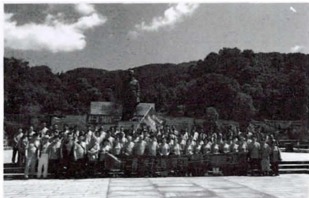
尤溪朱子文化园合影

7月17日,第12届朱子之路研习营来到朱子出生地尤溪县。是日下午14:00时,全体营员来到朱子文化园,参观尤溪博物馆、南溪书院,了解朱子出生时的点点滴滴以及朱子之于尤溪的影响。16:00时,全体营员回到尤溪宾馆聆听两场精彩的学术报告。韩国同德女子大学朱光镐老师为营员们分享他对《朱子格物致知的阐释学解释》的相关思考。朱光