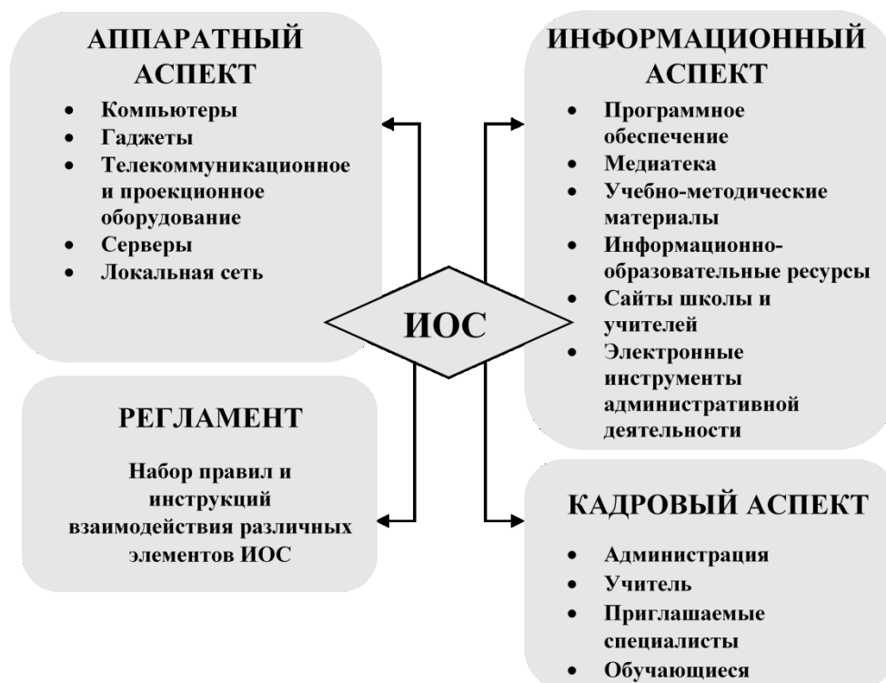
Рис. 3. Модель информационно-образовательной среды учителя

Каждые из представленных в модели блоков связаны между собой. Отдельная блочная связь должна быть рассмотрена детально. Компоненты внутри отдельного блока также связаны между собой и должны не противоречить друг другу, а дополнять и совершенствовать внутреннее взаимодействие. Рассмотрение блочной компоновки является отдельным вопросом в построении модели информационно-образовательной среды.