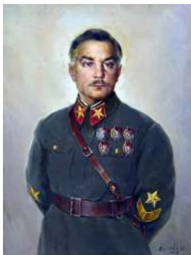
(Климент Ефремович Ворошилов)