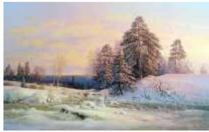
В. Ю. Жданов «Зимний пейзаж»