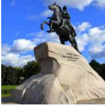
Скульптура Э. М. Фальконе «Медный всадник»