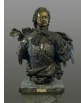
Б.-К. Растрелли Бюст Петра I

Образ Георгия Жукова представили следующие произведения искусства: репродукции картин: П. Д. Корин «Портрет маршала Г.К. Жукова», В. Н. Яковлев «Портрет маршала Г.К. Жукова», скульптура В. Клыкова «Памятник маршалу Жукову», кадр из фильма Б. Ермолаева и Б. Сумху «Слушайте, на той стороне» (актер М. Ульянов), А. Пименов «Бюст Маршала СССР Г.К. Жукова».