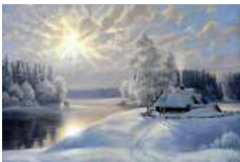
В. Рогов «Морозное утро»