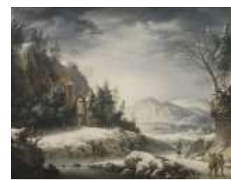
Ф. Фоски «Зимний пейзаж с пещерой»