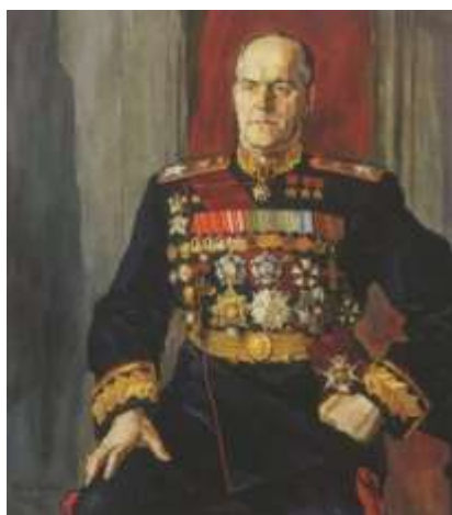
(Константин Георгиевич Жуков)

1. Советский полководец. Маршал Советского Союза, четырежды Герой Советского Союза, кавалер двух орденов «Победа», множества других советских и иностранных орденов и медалей. В послевоенные годы получил народное прозвище «Маршал Победы». Министр обороны СССР.