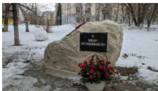
Памятник воинам – интернационалистам (г. Самара)