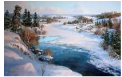
С. А. Панин «Русская зима»