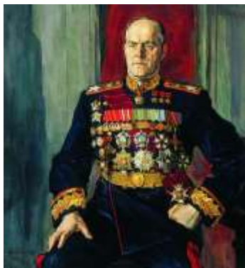
П. Д. Корин «Портрет маршала Г.К. Жукова»

Образ Георгия Жукова представили следующие произведения искусства: репродукции картин: П. Д. Корин «Портрет маршала Г.К. Жукова», В. Н. Яковлев «Портрет маршала Г.К. Жукова», скульптура В. Клыкова «Памятник маршалу Жукову», кадр из фильма Б. Ермолаева и Б. Сумху «Слушайте, на той стороне» (актер М. Ульянов), А. Пименов «Бюст Маршала СССР Г.К. Жукова».