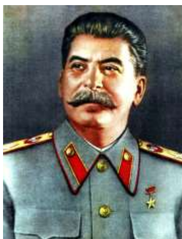
(Иосиф Виссарионович Сталин)

3. Российский революционер грузинского происхождения, советский политический, государственный, военный и партийный деятель, Генералиссимус Советского Союза. С конца 1920-х – начала 1930-х годов до своей смерти в 1953 году Сталин был лидером Советского государства.