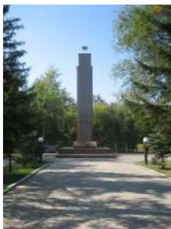
Обелиск воинам (г. Петропавловск)