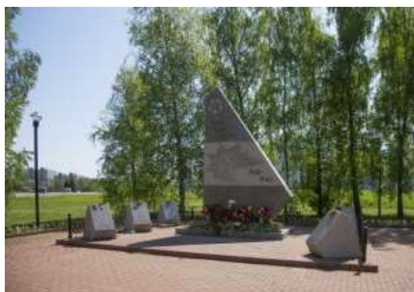
Памятник «Труженикам тыла и Детям войны» (пос. Горки Ленинские)