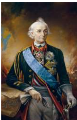
В. И. Нестеренко «Портрет А.В. Суворова»