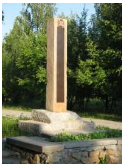
Памятник жертвам радиационных катастроф (г. Асбест)

Ведущий. Вы находитесь на этапе «Наблюдательность». Сейчас вам необходимо выбрать картинки с изображением памятников, которые есть в нашем городе (Асбест) и правильно их назвать. За правильное название памятника ваша команда получит 2 балла.