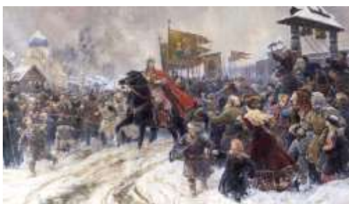
В. А. Серов «Въезд Александра Невского в Псков после Ледового побоища»