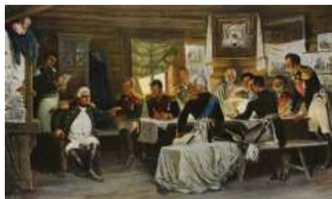
Картина «Военный совет в Филях» А. Кившенко

1. Какое историческое событие, отраженное в названии картины А. Кившенко, запечатлено на изображениях?