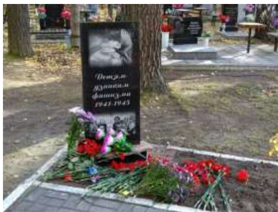
Памятник детям-узникам фашизма (г. Асбест)