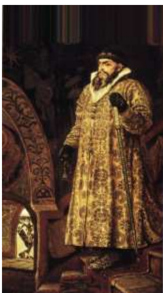
В. М. Васнецов «Иван Грозный»