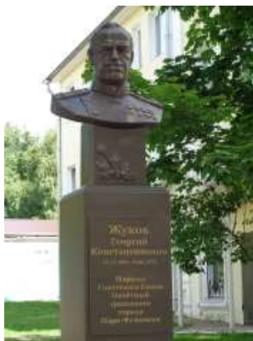
А. Пименов «Бюст Маршала СССР Г.К. Жукова»

Результаты задания оцениваются следующим образом.