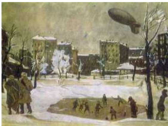
А. А. Дейнека «Вечер на патриарших прудах»