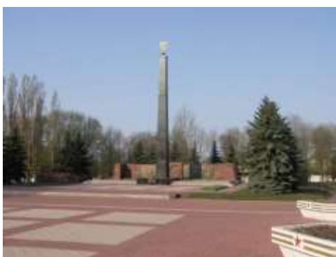
Мемориал павшим в годы Великой Отечественной войны (г. Курск)