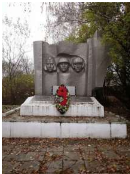
Мемориал Великой Отечественной войны (г. Москва)