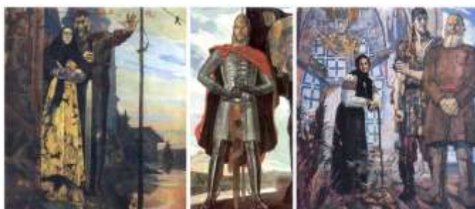
П. Д. Корин «Александр Невский» (центральная часть триптиха)