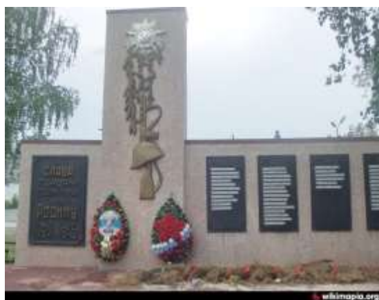
Мемориал Победы (возле ПАО «УралАТИ», г. Асбест)