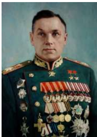
(Константин Константинович Рокоссовский)

3. Российский революционер грузинского происхождения, советский политический, государственный, военный и партийный деятель, Генералиссимус Советского Союза. С конца 1920-х – начала 1930-х годов до своей смерти в 1953 году Сталин был лидером Советского государства.