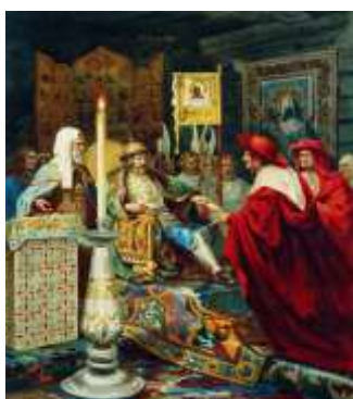
Г. Семирадский «Александр Невский принимает папских легатов»