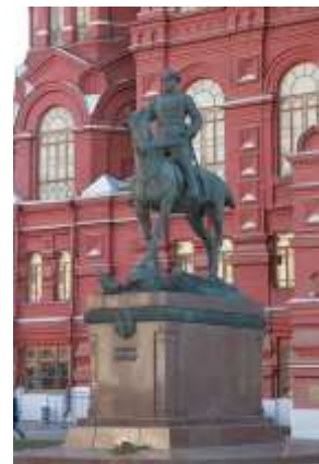
скульптура В. Клыкова «Памятник маршалу Г.К. Жукову»