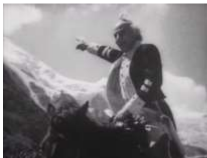
Кадр из фильма «Суворов» (режиссёры В. Пудовкин и М. Доллер)