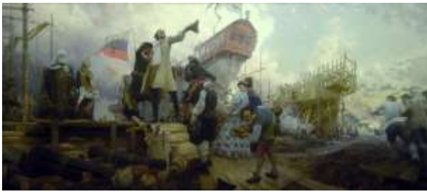
Ю. А. Куцевский «Новое в России дело»