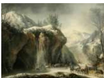
Ф. Фоски «Скалистый пейзаж с экипажем»