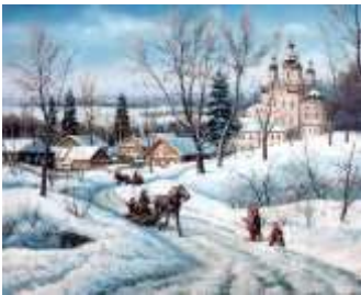
С. В. Ханин «Зимний пейзаж»

ет как время ограничений и испытаний («Зимний пейзаж с фигурами», «Зимний пейзаж с пещерой», «Зимний пейзаж с путешественниками», «Скалистый зимний пейзаж с экипажем», «Горный зимний пейзаж с путешественником»).