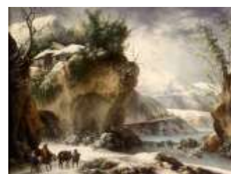
Ф. Фоски «Зимний пейзаж с путешественниками»