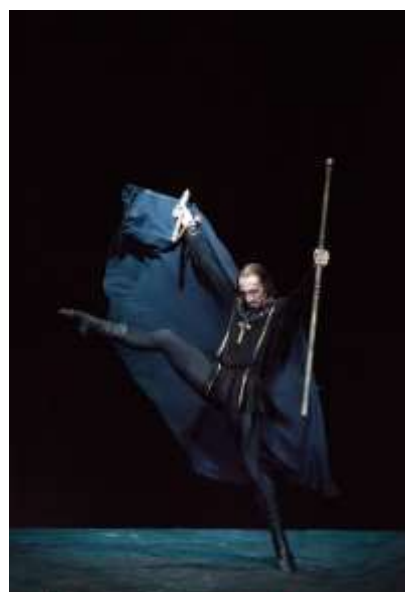
кадр из балета Ю. Григоровича «Иван Грозный»