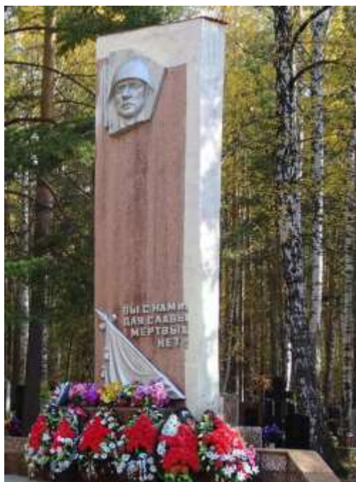
Памятник умершим от ран в госпитале (г. Асбест)