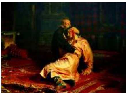
И. Е. Репин «Иван Грозный и сын его Иван»