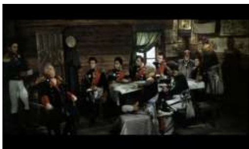
Кадр из широкоформатной художественной киноэпопеи «Война и мир» С. Бондарчука

Первое задание взято из заданий Регионального этапа Всероссийской олимпиады школьников по искусству (Мировой художественной культуре) 2018/2019 учебного года (11 класс, задание 1), где старшеклассникам предлагается рассмотреть репродукции двух картин (кадр из широкоформатной художественной киноэпопеи «Война и мир» С. Бондарчука и картины «Военный совет в Филях» А. Кившенко). Далее предлагается сравнить два изображения (репродукция картины и кадр из фильма) и ответить на вопросы.