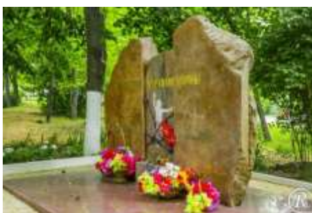
Памятник детям жертвам войны (г. Новороссийск)