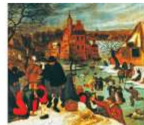
П. Брейгель «Катание на коньках»