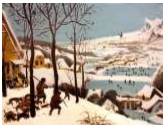
П. Брейгель «Охотники на снегу»