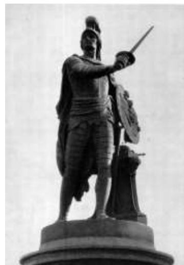
Скульптура М. И. Козловского «Суворов»