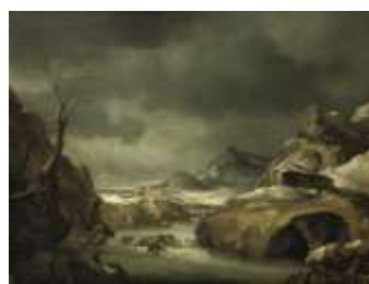
Ф. Фоски «Зимний пейзаж с фигурами»