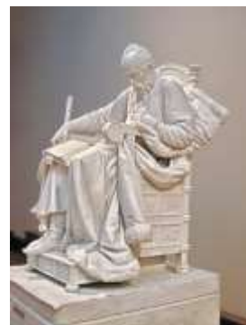
скульптура М. М. Антокольского «Иван Грозный»