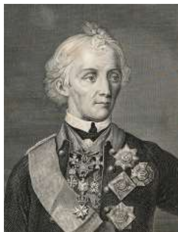
Гравюра Н. И. Уткина с портрета «А.В. Суворов»