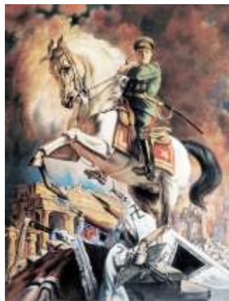
В. Н. Яковлев «Портрет маршала Г.К. Жукова»