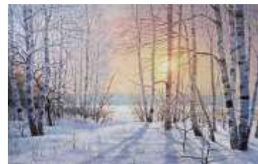
В. Мартюшев «Березы в зимнем лесу»