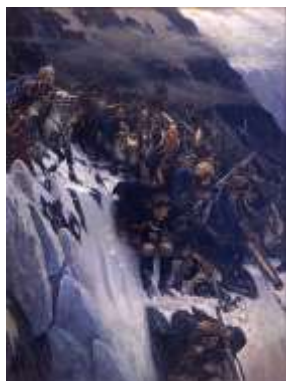
В. И. Суриков «Переход Суворова через Альпы»