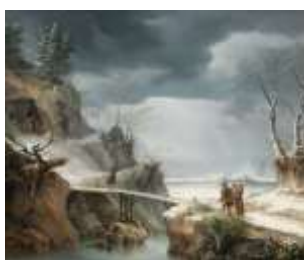
Ф. Фоски «Горный зимний пейзаж с путешественниками»