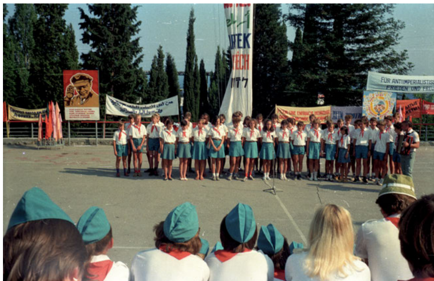
Abb. 14: Pionierlager Artek, 1986

ternationalen Kinder- und Jugendaustausches. Die Pionierlager waren Teil einer möglichst früh, also im Kinder- und Jugendalter greifenden und der Kleinfamilie entzogenen Erziehung zum sog. Neuen (= sozialistischen) Menschen. Die ideologische Indoktrination durch Erziehung war zum Teil durchaus kindgerecht 32 , junge Talente wurden gesucht und gefördert, berühmte Persönlichkeiten wie der Kosmonaut Jurij Gagarin (1934–1968) oder in- und ausländische Staatschefs wie Walter Ulbricht (DDR, 1893–1973), Georgi Dimitrov (Bulgarien, 1882–1949) oder Ho Chi Minh (Vietnam, 1890–1969) besuchten „Artek“. Die weitläufige, aus mehreren Haupt- und Nebenlagern bestehende Anlage setzte auch architektonisch Maßstäbe, besonders der Ausbau zwischen 1957 und 1966, der zudem die Kapazitäten so erhöhte, dass ab Mitte der 1960er Jahre jährlich über 20.000 Kinder und Jugendliche gleichzeitig dort Ferien machen konnten. 33