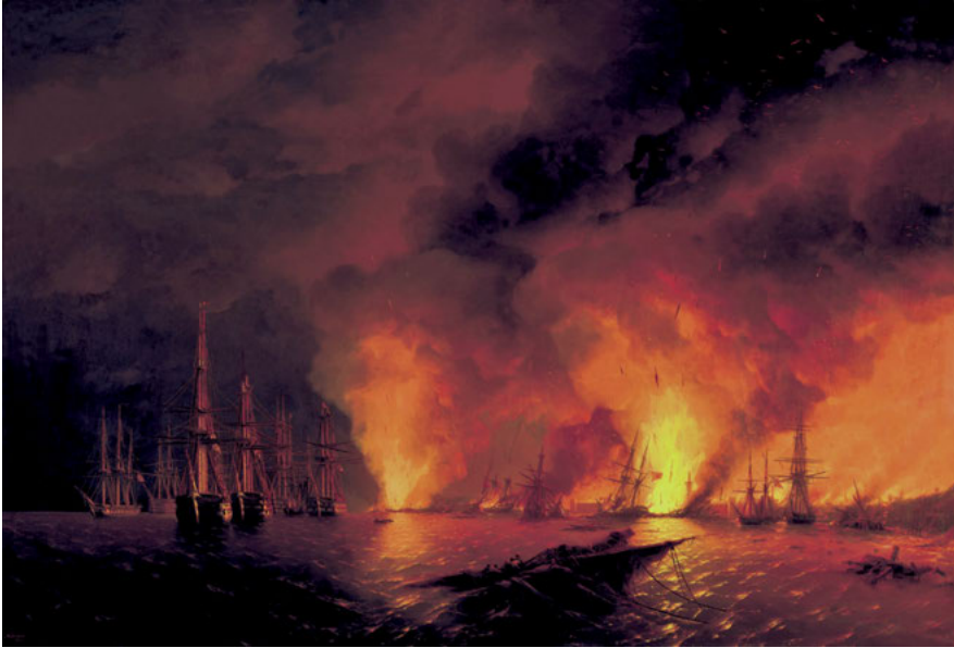
Abb. 8: Die Schlacht von Sinope am 18. November 1853 (Nacht nach der Schlacht), Gemälde von Ivan Ajvazovskij, 1853

Unbeteiligte ‚nachspürbarer‘. Vorreiter waren die „London Times“ und Akteure wie William Howard Russel (1820–1907) 12 , Roger Fenton (1819–1869) 13 oder James Robertson (1813–1888). Sie alle trugen dazu bei, dass der Konflikt untrennbar mit einem seiner Schauplätze, nämlich der Krim, verbunden und assoziiert wurde, wurde doch von dort viel berichtet. Photographien vom Schauplatz fanden schnell ihren Weg in das übrige Europa. Kriegs- und Heimatfront wurden und konnten dadurch leichter ‚zusammengedacht‘ werden, was insbesondere russischerseits im Kontext der 349 Tage von den Alliierten belagerten Stadt Sevastopol’ der Fall war. Dort – und darauf wird noch zurückzukommen sein – wurden Männer, Frauen und sogar Kinder AkteurInnen im Kriegsgeschehen.