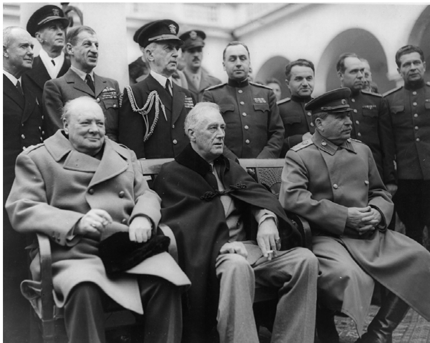
Abb. 13: Gruppenfoto bei der Konferenz von Jalta, 1945 (von links: Winston Churchill, Franklin D. Roosevelt und Josef Stalin)

Rus' als eine Wiedervereinigung zwischen ‚Groß-‘ und ‚Kleinrussen‘ (= Ukrainer). 8 In jedem Fall wurde 1954 der Transfer der Krim als eine Art Unterpfand für die ‚unverbrüchliche Freundschaft‘ zwischen diesen beiden zahlenmäßig größten Nationalitäten der Union präsentiert.