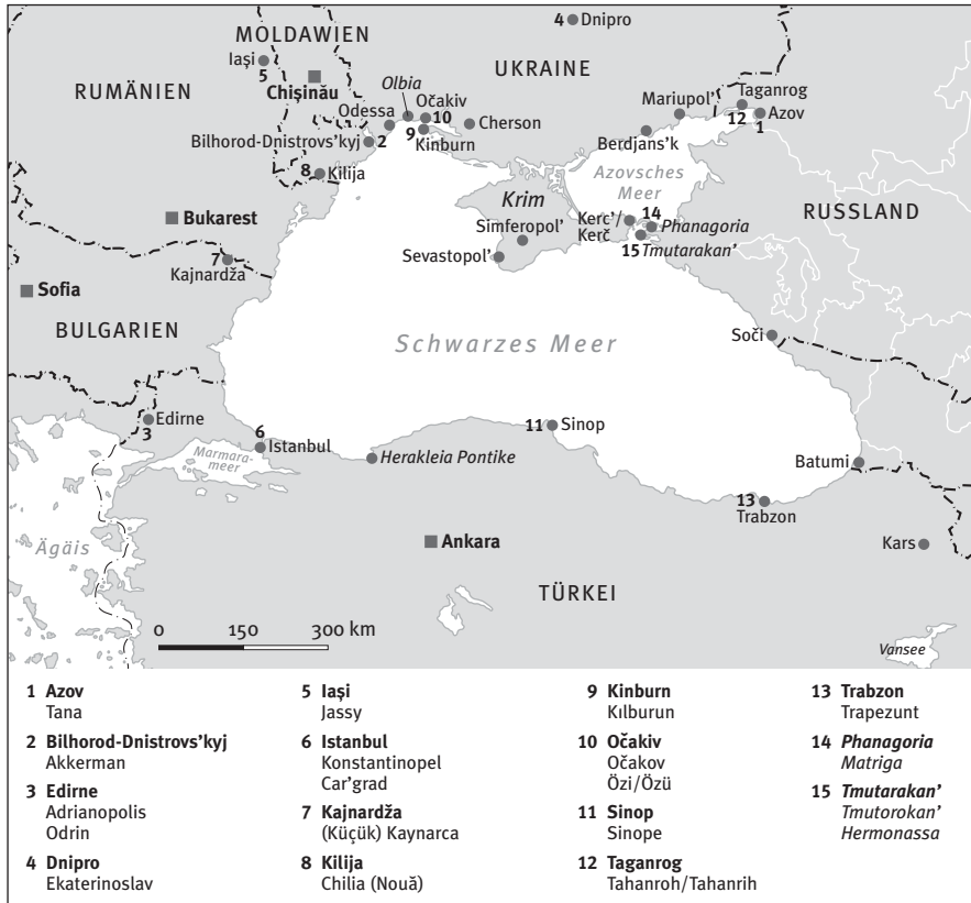
Karte der Schwarzmeerregion