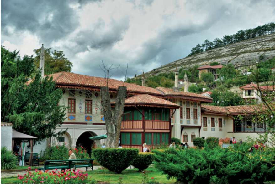
Abb. 6: Chan-Palast von Bağçasaray