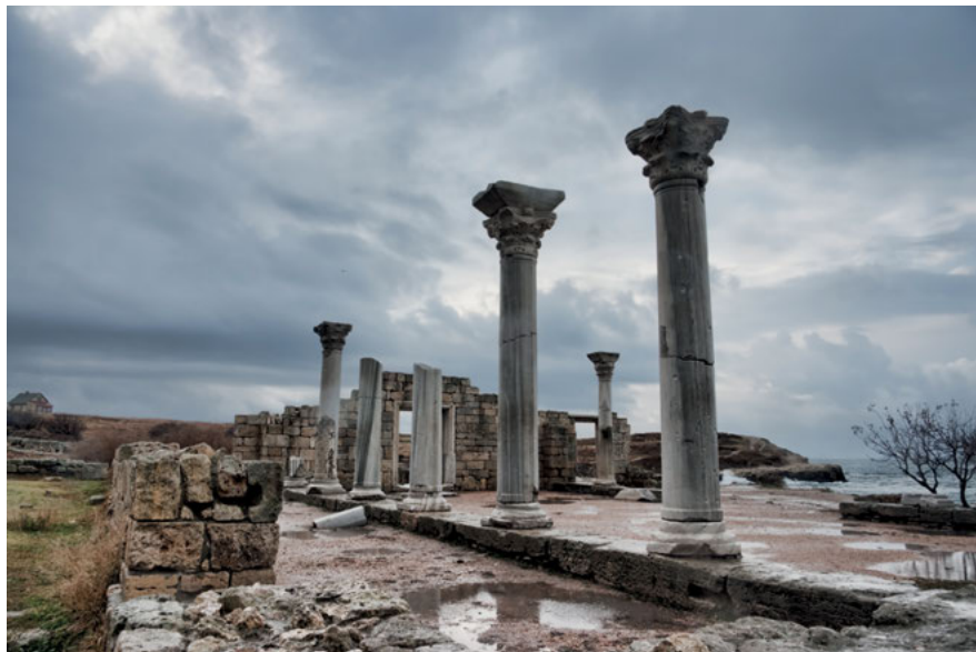
Abb. 4: Ruinen von Chersones

über die antike griechische kollektive Identität. 18 Die Migration in die Gebiete außerhalb des hellenischen Kernlandes formten diese zu einem komplexen Siedlungsmythos, der den Glauben an die eigene Überlegenheit gegenüber der autochthonen Bevölkerung zu verfestigen half. Unabhängig davon, ob die jeweiligen Geschichten die Gründung einer griechischen Kolonie auf der iberischen Halbinsel, im Mittelmeer oder eben auf der Krim erzählten, weisen sie eine recht ähnliche Grundstruktur auf: Eine Mutterstadt entsendet eine beträchtliche Zahl von KolonistInnen in die Fremde, wo diese eine griechische Siedlung gründen, welche von der indigenen Bevölkerung hart bekämpft wird. Selbstverständlich obsiegen die überlegenen Hellenen am Ende über die Barbaren. 19 Der realen Auswanderung aus dem Mutterland vorausgegangen waren – und dies ist der historische Hintergrund der griechischen Kolonistenbewegung – zumeist soziale und/oder politische Spannungen in der Metropole. In den legendisierten Erzählungen heißt es hingegen zumeist, Ausreisewillige hätten sich an das Orakel von Delphi gewandt, welches den Ratsuchenden die Auswanderung mit der Zustim-