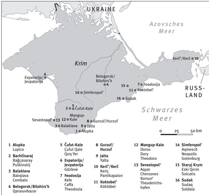
Karte der Krim