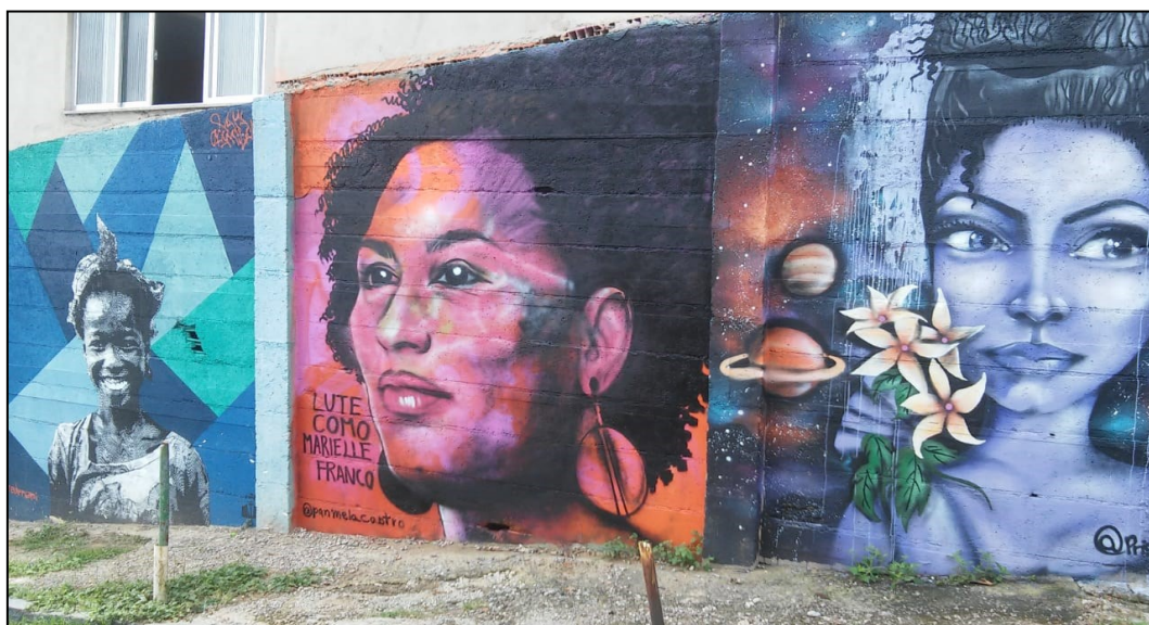
Figura 3 – Graffiti de Marielle atacado e restaurado no Museu Nami. É possível notar as marcas da tinta prateada do ataque.