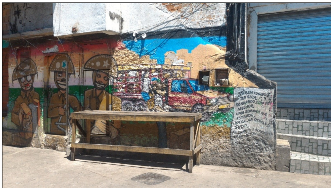
Figura 1 – Mural da presença nordestina no MUF. Nota-se a presença do cordel à direita da imagem.