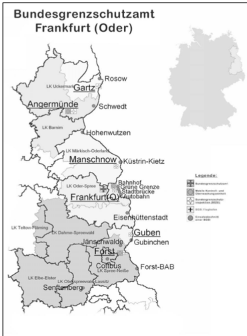
Abbildung 1: Bundesgrenzschutzamt Frankfurt (Oder)

Die grenzpolizeilichen Aufgaben umfassen, so will es das Gesetz über die Bundespolizei (BPolG), die grenzpolizeiliche Überwachung der Grenzen zu Lande, zu Wasser und aus der Luft, die polizeiliche Kontrolle des grenzüberschreitenden Verkehrs einschließlich der Überprüfung der Grenzübertrittspapiere und der Berechtigung zum Grenzübertritt, der Grenzfahndung und der Abwehr von Gefahren sowie im Grenzgebiet bis zu einer Tiefe von 30 km die Abwehr von Gefahren, die die Sicherheit der Grenzen beeinträchtigen. Die Struktur der Bundespolizei wurde mit Wirkung zum 1. März 2008 nach dem Willen des Bundesministeriums des Inneren (2008) verschlankt und effizienter gestaltet, um den Herausforderungen eventueller terroristischer Bedrohungen, wachsender Verkehrsströme und Schengen beitretender Nachbarstaaten gewachsen zu sein.