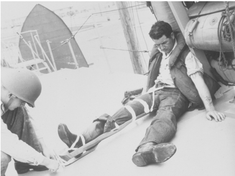
Abbildung 3: Demonstration der Beinschiene im Einsatz, 1942/43, © 2005 EAMES OFFICE LLC ( www.eamesoffice.com ).

Für Charles Eames ist dies die Möglichkeit, sich von seinem früheren Arbeitgeber Metro-Goldwyn-Mayer, wo er Filmsets entworfen hat, zu lösen und ein eigenes Studio aufzubauen. Im Zeitraum von 1942 bis 1945 wächst die Zahl der MitarbeiterInnen, die auf drei Standorte aufgeteilt werden, von drei auf 22, darunter WerkzeugtechnikerInnen, ArchitektInnen und BildhauerInnen. Im Team ist auch Harry Bertoia, der später durch eigene Möbelentwürfe Designgeschichte macht. Während dieser frühen Periode des Eames Office wird fast ausschließlich an der Verbesserung und Produktion der Beinschiene gearbeitet. Darüber hinaus werden Abwandlungen in Form von Armschienen und Tragbaren entwickelt. Im Gegensatz zur Beinschiene kommt es allerdings bei diesen Varianten nie zur Serienproduktion.