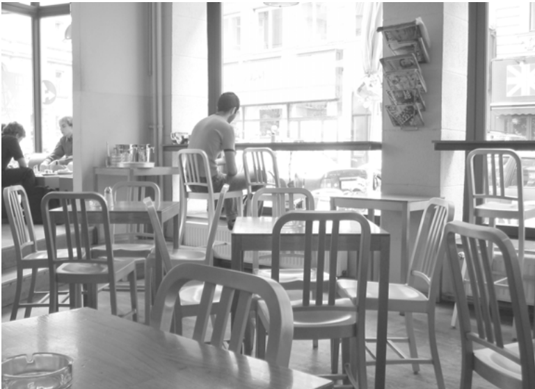
Abbildung 2: Ein In-Lokal in Wien, bestuhlt mit dem Navy Chair © Astrid Fingerlos, 2005.

Um dem No-Name-Entwurf von 1944 doch etwas von seiner Rohheit zu nehmen, beauftragt EMECO Ende 2000 den französischen Designer Phi-