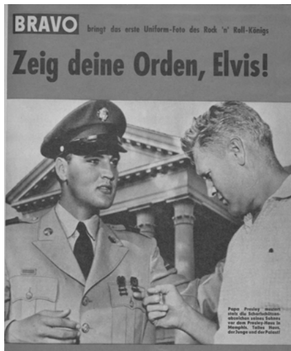
Abbildung 3: Das erste Uniformfoto zeigt den neuen, männlichen Elvis. Sein Vater mustert stolz die Scharfschützen-Abzeichen. Abgedruckt in „Zeig deine Orden, Elvis!“, Bravo , 29.6.1958, S.3

Forciert wurde die Ausweitung des Normalitätsfeldes in dem hier untersuchten Fall durch das Medienereignis »Elvis in Deutschland«, dessen physische Präsenz in Uniform den Diskurs prägte. Elvis' Imagewechsel nach seiner Einberufung 1958 wurde von seinem Manager Colonel Tom Parker genauestens vorbereitet und begleitet: 25 Presseberichte, Fotostrecken und Interviews zeichnen ein Bild von Presley als gewissenhaftem jungen Mann, der seinem Land dient. Bravo rekurrierte auf die amerikanischen Vorgaben und feierte den neuen »Elvis in Uniform« mit einer Artikelserie und verschiedenen Einzelberichten. 26 Indem das Jugendmagazin Presleys altes Popstar-Image mit seinem »realen« Leben als Soldat kontrastierte, transformierte es Elvis vom idealen Rebellen zum idealen »Bürger in Uniform«: