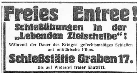
Abbildung 2: Werbeanzeige für »gefechtsmäßiges Schießen auf militärische Films« bei freiem Eintritt aus der Reichspost vom 29. Juli 1914.