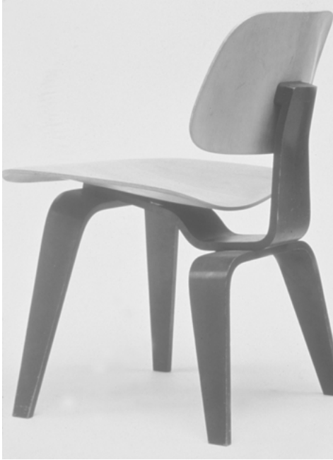
Abbildung. 5: DCW (Dining Chair Wood), Entwurf von Charles und Ray Eames, 1945, © 2005 EAMES OFFICE LLC (www.eamesoffice.com).

»Die Schichtholzstühle von Ray und Charles Eames, Meilensteine im modernen Möbelbau, sind das Ergebnis eines Forschungsprogramms, an dem die beiden während des Krieges arbeiteten« (Fiell/Fiell 1997: 255).