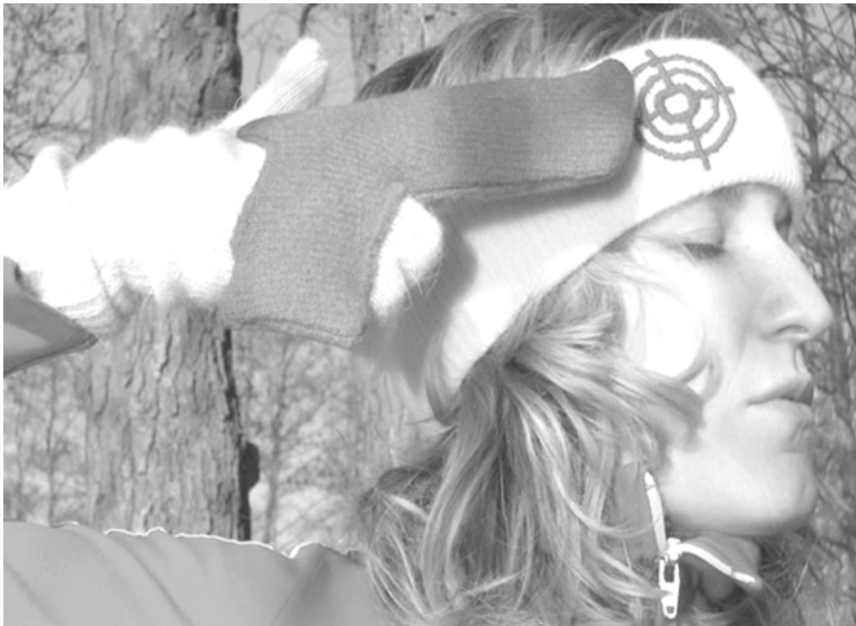
Abbildung. 6: Taking Aim, © Tonia Welter, UdK Berlin/designtransfer, Big Boys Toys, 2004.

Die Waffe war kürzlich Thema eines Semesterprojekts von Produkt-design-Studierenden der Universität der Künste in Berlin. Eine anschließende Ausstellung mit dem Titel »Big Boys Toys« bezieht Position zum Objekt Waffe. 10 Zu sehen war auch eine Arbeit des Künstlers Sencer Vardarman. Die Chart of Arms versammelt aus dem Internet heruntergeladene Bilder von Waffen und Pistolen von 171 Unternehmen aus 47 Ländern. Die penibel in alphabetischer Ordnung aufgereihten Bilder sind miniaturisiert und präsentieren sich formal verniedlicht und bagatellisiert als Tapete.