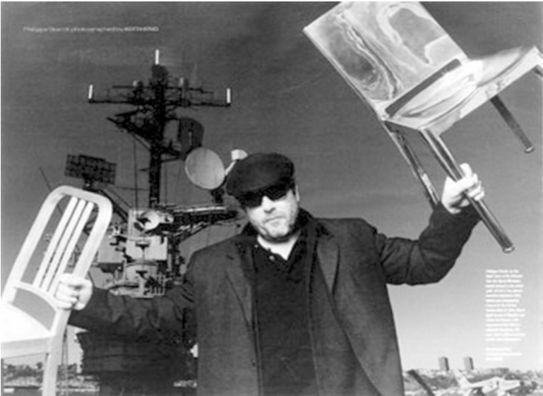
Abbildung 1: »Ship Shape« Coverstory zum Re-Design des Navy Chair © NY Times Magazine, Keith King, 1999.