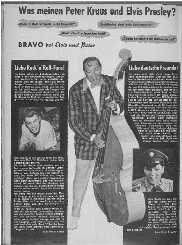
Abbildung 4: Nach dem Bill Haley-Krawall in Berlin leisten Presley und Peter Kraus, genannt der „deutsche Elvis“, Schadensbegrenzung. Elvis in Uniform fordert: „Stellt die Krachmacher kalt!“ Abgedruckt in „Schluß mit Rock 'n' Roll-Kommandos“, Bravo, 23.11.1958, S. 4.

Elvis Presley wurde eine respektable Karriere vom »schwarzen« Sänger zum »weißen« Schauspieler in Aussicht gestellt. »Wenn ich den Uniformrock ausziehe, werde ich einen Film machen, in dem ich überhaupt nicht singe!«, zitierte Bravo Elvis (»Dramatischer Elvis«, in: Bravo , 6.7.1958). Aus dem »verspielten Jungen« war »ein ganzer Mann«, »eine ernste Persönlichkeit« geworden (»Elvis Presleys Geburtstagshoroskop«, in: Bravo , 21.1.1960).