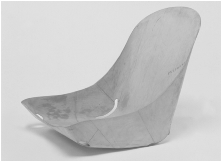
Abbildung 4: Charles und Ray Eames, 1943, © 2005 EAMES OFFICE LLC ( www.eamesoffice.com ).

»Although the large-scale aircraft work was of relatively short duration, the Molded Plywood Division gained invaluable skills and experience in producing the large pieces of molded Plywood« (Neuhart/Neuhart/Eames 1989: 43).