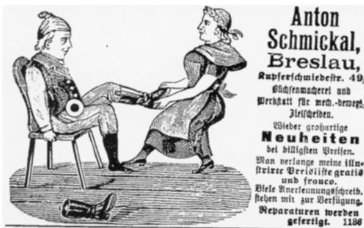
Abbildung 1: Werbeanzeige der Büchsenmacherfirma Anton Schmickal für Schießbudenzielscheiben. Aus: Der Komet Nr. 765 vom 18. November 1899 (Filmarchiv Austria).

Man kann solche Vorkommnisse als unglückliche Unfälle bezeichnen, aber sie sind auch subtile Indikationen dafür, dass bereits solche Unterhaltungsformen immer auch mit der Möglichkeit spielten, nicht nur kreisförmige Zielscheiben anzubieten, sondern solche in tierischer und sogar menschlicher Gestalt. Zahlreiche Anzeigen aus einschlägigen Magazinen weisen mit ihren Texten auf das programmatische Sortiment der Firmen hin: Mit dem Slogan »Büchsenmacherei und Werkstatt für mech.-bewegl. Zielscheiben« wirbt einer der Anbieter um die Gunst der Schießbudenbesitzer. Die dazugehörigen Illustrationen zeigen Tierformen wie etwa Bären, aber auch Menschen, die den Vergnügungssüchtigen als Zielscheiben dienen. Eine andere Annonce aus dem Jahr 1899 zieht die Angelegenheit sogar unverhohlen ins Persönlich-Private, lautet der Begleittext doch: »Schiss-Automat [...] mit 7 versch. Zielen u.a. Musik, Mühle, Hase, Papa, Mama.«