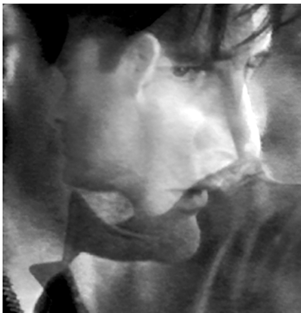
Abbildung 2: Filmmontage aus Lost Highway

»Godard hat gesagt, ein Film brauche einen Anfang, eine Mitte und einen Schluss, aber nicht unbedingt in dieser Reihenfolge.« 67