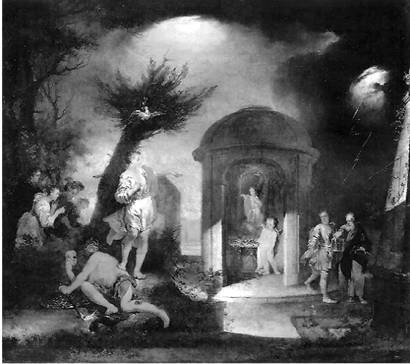
Abbildung 2: Newtons Verdienste um die Optik von Januarius Zick; entstanden um 1785/ 95 n.Chr., 63 x 73 cm, Niedersächsische Landesgalerie Hannover.

Im Beisein von Mrs. Herbert, gleichsam als Vorspiel des Sexualaktes, nimmt Neville das Bild von der Wand, stellt es auf einen Stuhl und beginnt eine Erörterung. Er will in der nächtlichen Gartenszene des Bildes Treulosigkeiten und Mordvorbereitungen erkennen. Mit dieser Fehlinterpretation kommt der Zeichner zwar dem Schicksal von Mr. Herbert (und ironischer Weise auch seinem eigenen) ziemlich nahe und erweckt zudem den Anschein, er ahne etwas über die tatsächlichen Vorgänge auf dem ländlichen Anwesen, aber wenn dem wirklich so wäre, so übersieht er dabei völlig die Bedrohlichkeit seiner eigenen Lage. Und das ist der springende Punkt, denn in Zicks Gemälde geht es um das richtige Sehen – die optische Theorie: Links tritt Isaac Newton (1643-1727), der große Mathematiker und Physiker, als Genius der