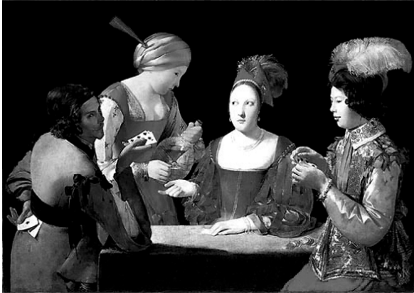
Abbildung 1: Der Falschspieler mit dem Kreuz-As nach Georges de la Tour. Fotomontage aus beiden Falschspieler-Bildern La Tours von Josef Mittlmeier für ein Ankündigungsplakat des Graduiertenkollegs »Kulturen der Lüge«. Regensburg 2001.

Links der Falschspieler, der dem Betrachter zugewandt ist und diesen in das falsche Spiel mit einbezieht, indem er ihm mit der rechten Hand sein Blatt zeigt und mit der linken, wie er es aufzubessern gedenkt. Dem Falschspieler gegenüber sitzt rechts ein junger, wohlbetuchter Mann, der sein Geld sorglos vor sich auf dem Tisch liegen hat, während es der Falschspieler mit dem aufgestützten Ellbogen vor dem Zugriff der Mitspieler schützt. Das kindlich-runde Gesicht des Jünglings und sein naiver Blick in die Karten, die er mit beiden Händen etwas unbeholfen ganz nah bei sich hält, spiegeln seine Unerfahrenheit wider, die ihn zur leichten Beute werden lässt. Das Zentrum des Bildes füllt eine anmutige Spielerin aus, der von einer Bediensteten Wein gereicht wird. Das helle Gesicht der Dame und ihr schneeweißes Dekolleté stehen im Kontrast zum dunklen Hintergrund und dominieren das Bild. Man darf vermuten, dass es sich dabei um eine Kurtisane handelt, die mit dem Lügen-Spiel ihrer Augen und Hände das Geschehen heimlich dirigiert und mit ihren Reizen beim Jüngling für die nötige Ablenkung vom Spiel sorgt, die der Falschspieler geschickt ausnutzen wird. 14 Die