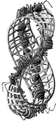
Abbildung 1: M.C. Escher: Möbiusband II, Holzstich, 1963

Die Ameisen aus Lynchs Kindheit begegnen uns fraprierenderweise auf dem von Escher gezeichneten Möbiusband wieder. Ähnlich diesen unendlich marschierenden Ameisen scheint sich auch die Handlung des Filmes in einer medialen Endlosschleife der Narrativik zu bewegen.