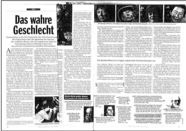
Abb. 2: Femalism feiert das Weibliche (von Bredow 2000).

In welchen Kontext diese gestellt werden, ist allerdings problematisch: Seit etwa 1995 und besonders in den Jahren 1999/2000 wurde eine Fülle an Artikeln veröffentlicht, die wie nie zuvor die Biologie der Frau bejubeln, ihre Fruchtbarkeit; die riesigen, mächtigen Eizellen der Frauen, die nicht mehr passiv auf die Spermien warten, wie noch vor etwa zehn Jahren, sondern sie geradezu aggressiv verschlingen; die vernetzte Intelligenz der Frauen durch ein zwar kleineres Gehirn, dessen Zellen aber untereinander umso stärker vermitteln, wird hervorgehoben und die sprachlich-sensible, soziale Intelligenz betont; ebenso wie die Tatsache, dass Frauen biologisch ein höheres Alter erreichen als Männer als evolutiver Fortschritt gedeutet wird und derlei vieles mehr.