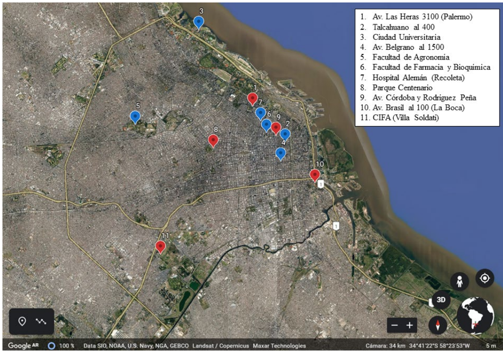
Figura 1. Imagen de Google Earth de la Ciudad de Buenos Aires, con la ubicación de los sitios de monitoreo de calidad del aire. En rojo: estaciones operadas por la APRa. En azul: puntos de muestreo relacionados a proyectos de investigación (sólo se incluyen aquellos donde se midió continuamente durante tres meses o más).

tamaño (Korc y Sáenz, 1999). Un primer análisis permitió detectar que un tercio de los datos excedían los niveles de referencia (los que eran valores arbitrarios, ya que aún no existía legislación al respecto) con una tendencia a disminuir para ambos tipos de partículas, pero a aumentar para el SO_2 (CEPIS, 1982). Teniendo en cuenta estos resultados, a partir de 1978 se prohibió el uso de incineradores domiciliarios de basura en la ciudad (Mayol, 2014).