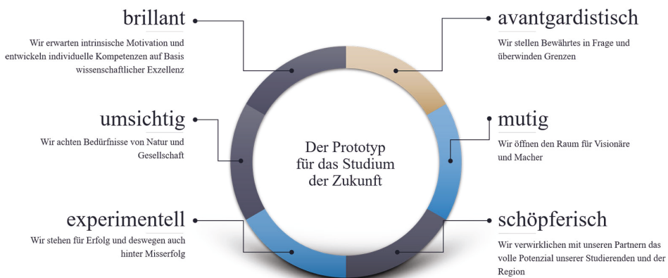
Abbildung 3: Vision des Studiengangs

Die aufgezeigten Aspekte machen deutlich, dass zur Gestaltung eines derart neuen, experimentellen und praxisorientierten Studiengangs viel mehr benötigt wird als die adäquate Zusammenstellung von Lehrinhalten. Der damit verbundene Lernprozess führt selbstverständlich auch dazu, dass sich Denkmuster verinnerlichen und Prozesse über die Zeit etablieren müssen. Authentizität umfasst daher auch eine offene Kommunikation des experimentellen Charakters und ggf. damit verbundener Hürden und Widerstände sowohl gegenüber der Studierenden und Projektpartner, aber auch gegenüber eher traditionell orientierten Kolleginnen und Kollegen. Um dies zu verwirklichen, wurde eine Vision entwickelt, die aufzeigen soll, dass sich nicht nur die im Studiengang behandelten Projekte im stetigen Wandel befinden, sondern auch der Studiengang selbst (vgl. Abb. 3).