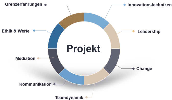
Abbildung 1: Module und Studieninhalte

Die Studierenden arbeiten projektspezifisch in kleinen Teams, meist befristet auf ein Semester an der jeweiligen Aufgabenstellung. Lehrende können in diesem Konzept zwei völlig unterschiedliche Rollen einnehmen: Zum einen bleibt die Funktion als Persönlichkeiten der klassischen Wissensvermittlung, die z. B. im Rahmen einer Vorlesung die methodischen Grundlagen für ein bestimmtes Themenfeld kreieren. Zum anderen kommt die Rolle eines Projektbegleiters oder Coaches hinzu. Analog zu Greif (2005, S.7) wird das Coaching als Instrument „zur Verbesserung der persönlichen Effektivität“ eingesetzt, was im Rahmen der Projektarbeit sowohl auf individueller als auch auf Gruppenebene geschieht. Die Rolle des Coaches (vgl. Abb. 2) dient während der Projektarbeit als eine Art von Scharnierfunktion zwischen den Studierenden und Dozierenden, indem die Fachexpertise der Lehrenden mit den in der praktischen Arbeit aufgedeckten Bedarfen abgeglichen wird (Wiemer, 2012). Konkret bedeutet dies z. B., dass der Coach die studentische Projektgruppe in einer geeigneten Situation darauf hinweist, dass an etwaiger Stelle die Nutzung einer bestimmten Methode sinnvoll wäre und die Expertise hinsichtlich der Anwendung dieser Methode bei einem bestimmten Lehrenden oder externen Experten liegt, den die studentische Projektgruppe hinzuziehen könnte (oder auch nicht).