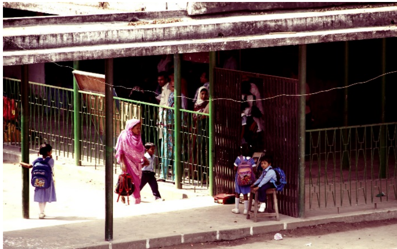
Abbildung 9: Eltern bringen ihren Nachwuchs in die Grundschule. Dhaka, 2012