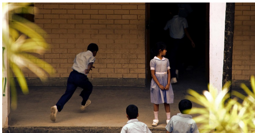
Abbildung 10: Grundschülerinnen und Grundschüler stürmen bei Pausenende in die Klassenzimmer, Dhaka, 2012

Zwar besuchen über 95 Prozent der Sechsjährigen die erste Klasse, doch lediglich 50 Prozent der 11- bis 15-jährigen Jungen und Mädchen besuchen auch weiterhin noch die Schule. Die Abbruchquote in der weiterführenden Schule (nach der Grundschule) beträgt 58,29 Prozent bei Jungen und 66,18 Prozent bei Mädchen (vgl. Maleque 2009, S. 126–127). Nur wenige Kinder und Jugendliche wachsen in privilegierten Verhältnissen auf und können eine umfassende Schulbildung genießen, die es ihnen künftig ermöglicht, eine angemessene Arbeit zu finden und so etwas zum Wohlstand des ganzen Landes beizutragen: