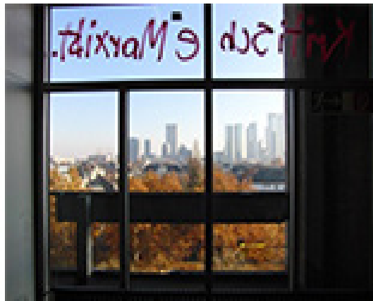
Abbildung 3: Aussicht aus dem AfE-Turm auf Frankfurts Skyline, 2012