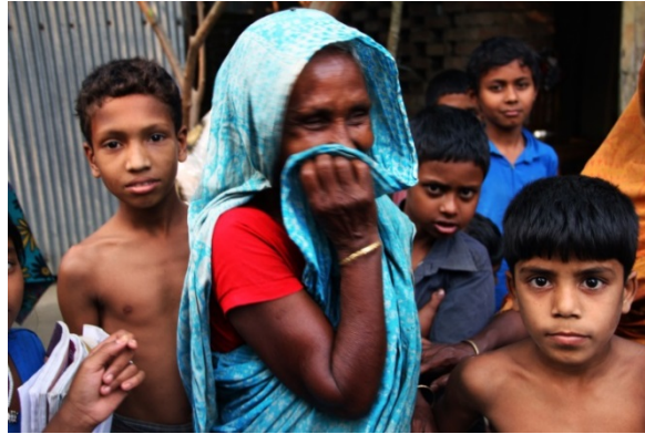
Abbildung 8: Beispiel für ein Bild in wissenschaftlichen Texten

Folgend wird ein Beispiel aufgeführt, wie sich ein fotografisches Bild mit dem Text auf geeignete Weise verbinden lässt: