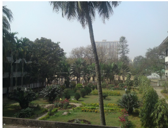
Abbildung 6: Ausblick aus dem Institut auf den fachbereichseigenen Garten, Dhaka, 2012 (Quelle: von den Probandinnen angefertigten Fotografie)