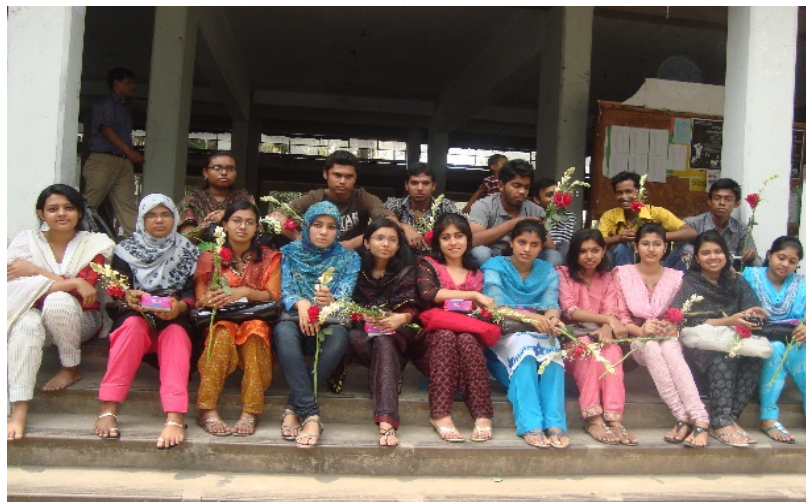
Abbildung 7: Studierende machen ein gemeinsames Foto von ihrem Jahrgang als Erinnerung, Dhaka, 2012

Die von den Probandinnen und Probanden angefertigten Fotos (vgl. Abbildungen 5 bis 7) vermitteln die Wahrnehmung der Studierenden der Dhaka Universität: Betrachtet man die Wahrnehmung der sechs Befragten hinsichtlich der Studienbedingungen, so lässt sich erkennen, dass die drei Studentinnen aus Bangladesch empfinden, zu den Privilegierten der Gesellschaft zu gehören, also zu denjenigen, die nicht den 87 Prozent der Bevölkerung angehören, die unter der Armutsgrenze und unter schlechten sozioökonomischen Bedingungen leben. Dementsprechend empfinden sie große Dankbarkeit, zu den Zukunftsträgerinnen Bangladeschs zu gehören und das auch noch an der größten und angesehensten Universität des