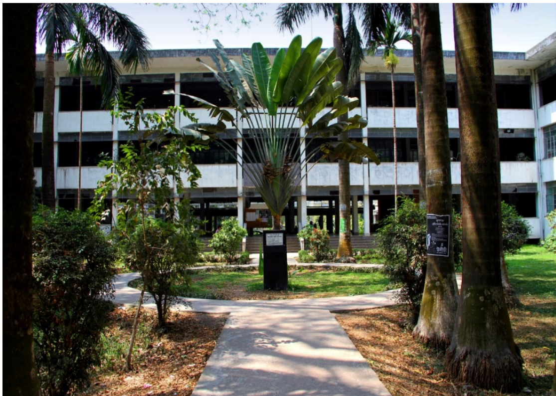
Abbildung 1: Repräsentativer Eingangsbereich zum Institute for Education & Research mit gepflegtem Vorgarten. Dhaka University, 2012

Der Anspruch, möglichst präzise und realitätsnahe Ergebnisse zu sichern, erforderte zum einen den persönlichen Aufenthalt zum Zweck der Forschungsarbeit an der Goethe-Universität in Frankfurt am Main sowie eine Forschungsreise an die University of Dhaka nach Bangladesch, um dort durch einen zweimonatigen Forschungsaufenthalt gleiche Ausgangsbedingungen für diese Untersuchung zu gewährleisten. Die Eindrücke dieser Forschungsreise wurden mittels Fotografien festgehalten (vgl. Abbildungen 1 und 2).