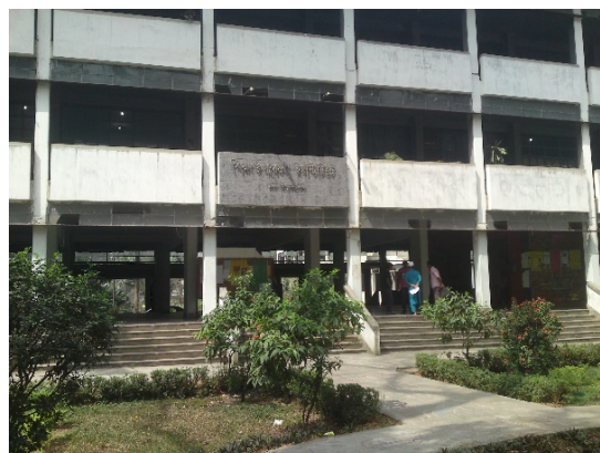
Abbildung 5: Institute of Education and Research, Dhaka, 2012