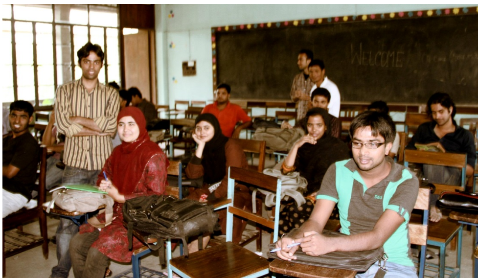
Abbildung 11: B.A.-Studierende am Fachbereich Education & Research im Seminarraum an der Dhaka University, 2012

Die Interviews mit den Probandinnen und Probanden zum Forschungsgegenstand hatten eine Aushandlung der subjektiven Sichtweisen der Interviewten zum Ziel. Die im Kurzfragebogen enthaltenen Informationen und Fragen dienten dazu, den Gesprächseinstieg zu erleichtern. Eine vorformulierte Einleitungsfrage diente als Mittel der Zentrierung des Gesprächs auf das zu untersuchende Problem. Die Herausforderung bestand darin, eine Frage so offen zu formulieren, dass sie für die Interviewten wie „eine leere Seite“ wirkte, die in eigenen Worten und mit eigenen Gestaltungsmitteln gefüllt werden will (vgl. Baumgart 2007, S. 212).