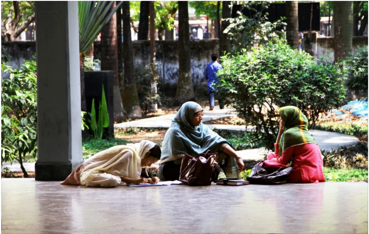
Abbildung 2: Studentinnen bereiten sich in der Mittagspause auf die bevorstehende Präsentation vor. Dhaka University, 2012

Die Arbeit teilt sich in einen theoretischen und einen methodischen Hintergrund sowie in einen empirischen Teil der Feldforschungsergebnisse. Unter dem methodischen Hintergrund wird die Grundlage der angewandten wissenschaftlichen Methodik erläutert. Im Zentrum stehen hierbei der Einsatz von Fotografie in der Sozialforschung, das Problemzentrierte Interview als Erhebungsverfahren und die Reflexive Fotografie als ein qualitativer methodischer Zugang zu den persönlichen Lebenswelten der Studierenden im universitären Kontext.