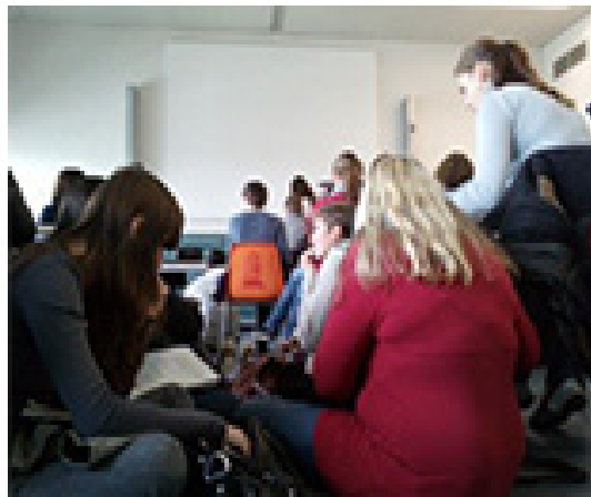
Abbildung 4: Studierende im überfüllten Seminarraum im AfE-Turm, Frankfurt, 2012