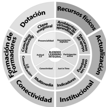
Figura 4. La convergencia ontológica de los tres actores fundamentales en el B-learning integral COTABLI. Elaboración propia

El B-learning, no es solo abrir un blog o un chat grupal, o realizar uno que otro video tutorial, o tener canales de comunicación directa con los estudiantes con grupos en redes sociales, sino diseñar un plan institucional en el que se establezcan protocolos, procesos y procedimientos claros exigibles no solo a los docentes sino también a los estudiantes, y que la misma institución facilite los recursos para favorecer un ambiente contemporáneo de aprendizaje con sus modelos que competen y que actualmente demanda el joven estudiante. Para esto se requiere que las instituciones formen a sus docentes actuales en el modelo B-learning y adicional a estas capacitaciones continuar con el reclutamiento adecuado en el momento de contratación del docente antes de ingresar a trabajar allí, como por ejemplo evaluaciones en competencias digitales y combinaciones de lo presencial y virtual para su pedagogía en clase. Así la institución realiza un proceso de transformación paulatina de su cuerpo docente hasta obtener una adaptación definitiva del modelo B-learning.