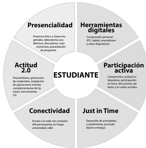
Figura 1. El estudiante como actor beneficiado en el B-learning – COTABLI 1. Elaboración propia

Es necesario la reflexión hacia esta gran parte de la población académica, quienes con la ausencia de recursos y la falta de políticas claras que les permita de manera más fácil la pandemia, no tengan que recurrir a la deserción académica para el segundo semestre del 2020 y principios del 2021, esto va más allá de alivios económicos en rebajas de matrículas e inscripciones. Del mismo modo, el estudiante, producto de la crisis pandémica, tuvo que adaptarse al cambio repentinamente y adquirir sin derecho a objetar, las diferentes características propias que debe tener un estudiante 2.0 en medio de la era de la 4ta revolución industrial.