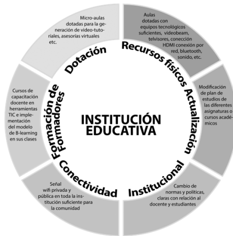
Figura 3. La Institución como tercer actor necesario en el B-learning – COTABLI 3. Elaboración propia

Como tercer actor dentro de esta atmósfera es el rol importante que cumple la institución académica (Figura 3), de igual forma se requiere una planeación estratégica basada en competencias que permita en el estudiante escenarios para desarrollar su desempeño académico brindando solución a situaciones problemáticas, CARRIAZO, PÉREZ & GAVIRIA 28 sugieren que la institución debe contar con una política estratégica, contemplar una infraestructura específica, infoestructura, servicios de apoyo, presupuestos y recursos específicos; pues la institución académica debe estar alineada y consecuente con los propósitos del modelo B-learning como modelo pedagógico.