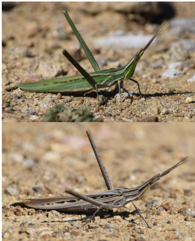
1. ábra. A sisakos sáska zöld és barna színváltozata a Nyugat-Mecsekben (Kővágószőlős, Kajdacs).

2019 augusztusában és szeptemberében botanikai valamint faunisztikai vizsgálatokat végeztünk a Villányi-hegység és a Mecsek területén. A sisakos sáska példányok észlése vizuális megfigyeléssel és fűhálós rovargyűjtéssel történt. Mivel egyértelműen azonosítható, de védett és lokálisan ritka fajról van szó, a példányok nem kerültek begyűjtésre, bizonyító erejű fényképek azonban készültek róluk (1. ábra).