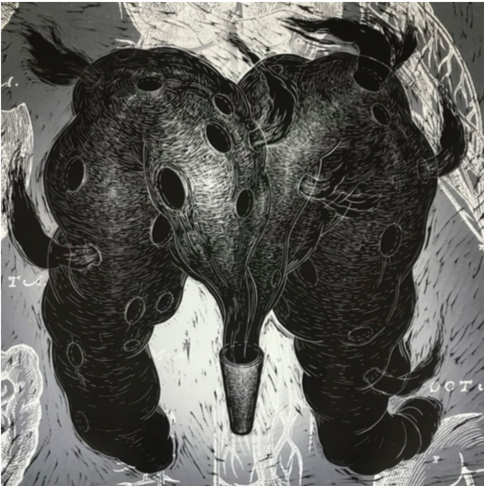
Sean Caulfield Gravure sans titre tirée du livre d'artiste Infodemic Relief et jet d'encre, 58 x 58cm, 2020

La façon dont les scientifiques communiquent leurs travaux dans les médias, dans les médias sociaux et directement au public, doit également être examinée. La façon dont les travaux sont communiqués sur les réseaux sociaux, par exemple, peut conditionner les citations subséquentes, mais aussi leur traitement dans le discours public et politique (Kousha et Thelwall 2020). Les membres de la communauté scientifique sont de plus en plus incités à présenter les résultats de leurs travaux en des termes enthousiastes. En effet, des pressions et des incitations se font sentir à toutes les étapes du processus de création du savoir pour encourager les chercheurs à mousser la valeur de leurs travaux (Bubela 2006; Bubela et al. 2009; Caulfield et Condit 2012), que ce soit lors de la présentation des demandes de subventions (Matthews 2016), de la rédaction des résultats (Vinkers, Tijdink et Otte 2015), de la production des communiqués de presse des