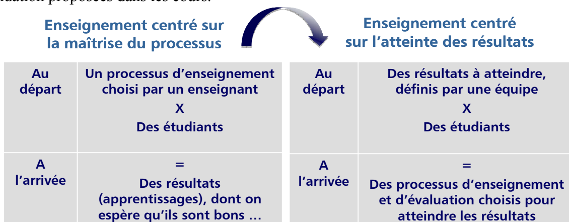
Figure 2 : Le concept d'acquis d'apprentissage, un changement de perspective

D'une approche de l'enseignement centrée sur la maîtrise des intrants et du processus, le concept d'apprentissage propose de basculer vers une approche de l'enseignement centrée sur l'atteinte des résultats (cf. figure 2). L'effet recherché, outre la plus grande lisibilité et comparabilité des programmes de formation, est le renforcement de la cohérence du programme par un travail qui doit nécessairement intervenir collégalement. Définir des résultats d'apprentissage implique donc de s'intéresser au programme dans son ensemble et d'être attentif à ce que les objectifs annoncés en termes de résultats d'apprentissage soient en cohérence avec les méthodes d'enseignement et d'évaluation proposées dans les cours.