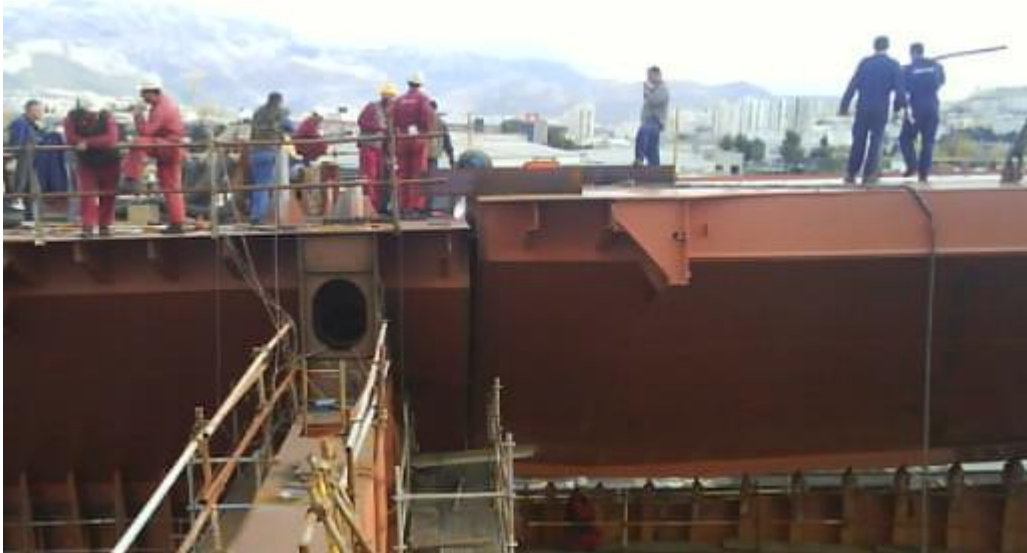
Slika 15. Radovi pri pozicioniranju sekcije

Podešavanje sekcije se sastoji od manjih radova na sekciji. Uglavnom su to obrezivanje montažnih viškova da bi se sekcija mogla točno pozicionirati na mjesto određeno tehničkom dokumentacijom. U ovoj fazi sudjeluju zavarivači, rezači, brodomonteri i dizalčari, i svi moraju ostvariti visoku razinu komunikacije da bi se posao obavio, prikaz na slici 15.