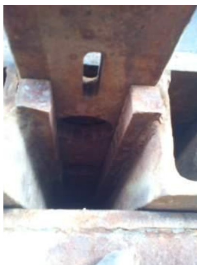
Slika 8. Čelično dno pješčane kutije sa rupama za pijesak