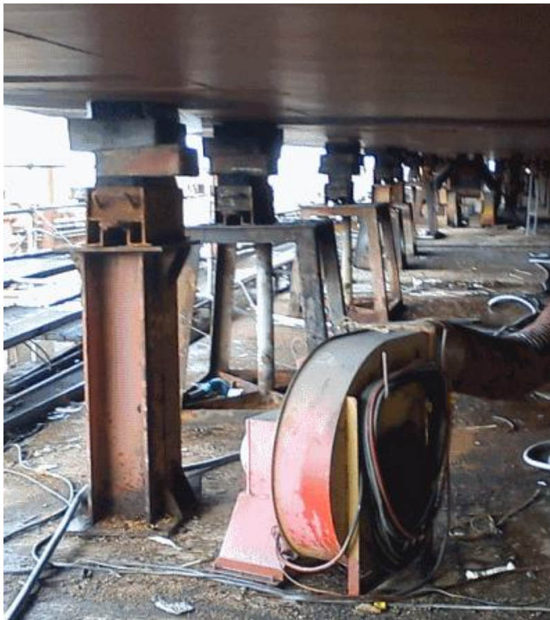
Slika 6. Trup broda na potkladama

Raspored potklada najviše ovisi o rasporedu masa broda, a pošto je najveća masa broda smještena u strojarnici tamo je raspored potklada gušći. Općenito potklade su najgušće postavljene ispod kobilice broda jer se baš preko tih središnjih potklada prenosi oko 75% od ukupne težine broda, na slici 6 prikazan je trup broda na potkladama.