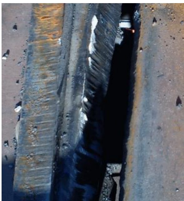
Slika 20. Mjesto spoja dvaju sekcija prije pripreme za zavarivanje

Privarivanje ili jemčenje sekcija sastoji se u ručnom zavarivanju na nekim mjestima spoja sa drugom sekcijom. Nakon što se sekcija privari, a prije nego li se potpuno zavari, mora se izvršiti kontrola pripojenog spoja za zavarivanje. Tu kontrolu obavlja brodogradilište, ali konačnu odluku da li je sekcija pogodna za zavarivanje donose predstavnici registra i brodovlasnika. Kod privarivanja sudjeluju samo zavarivači.