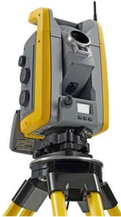
Slika 24. Elektronski tahimetar