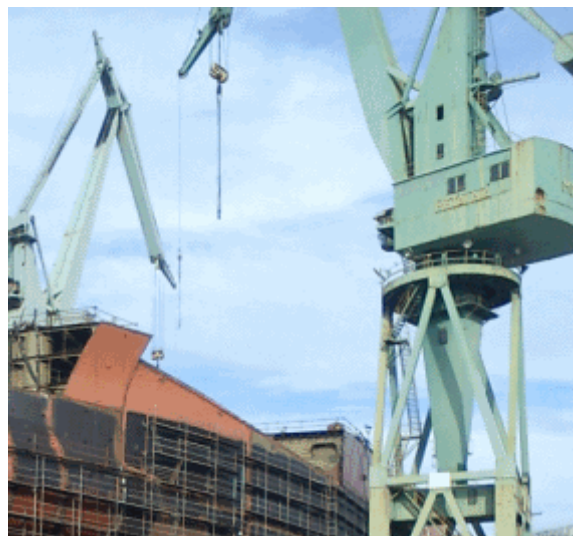
Slika 9. Dvije 100t dizalice u radu na navozu