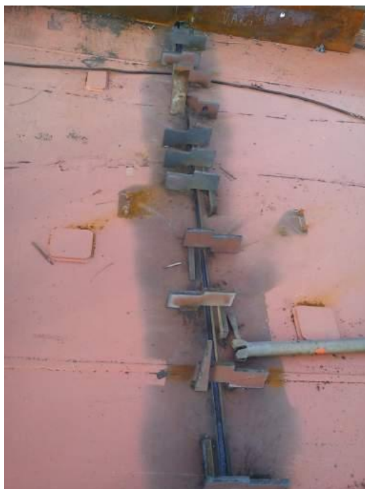
Slika 19. Klinovi za korekciju oblika i položaja sekcije

Klinovi su jedan od načina podešavanja sekcija, prikazani su na slici 19, a također se koriste kao elementi za regulaciju zavara sekcijskog spoja.