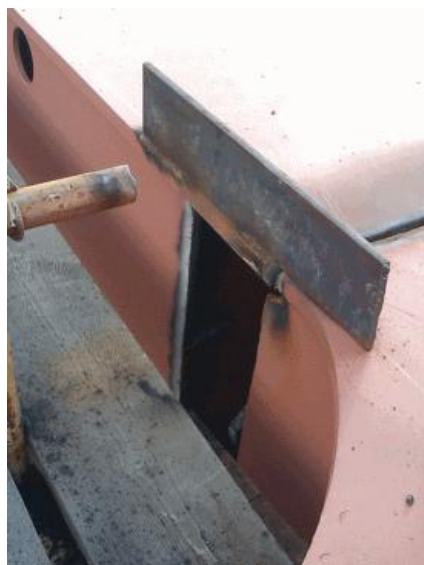
Slika 16. Problematična lokacija kod montaže sekcije

Da bi se riješio problem, odrezano je više nego predviđeno tehnološkim viškom sa ranije montirane sekcije kako bi potpalubni bočni tank sjeo na svoje mjesto, te da bi bili u mogućnosti pravilno montirati sekciju.