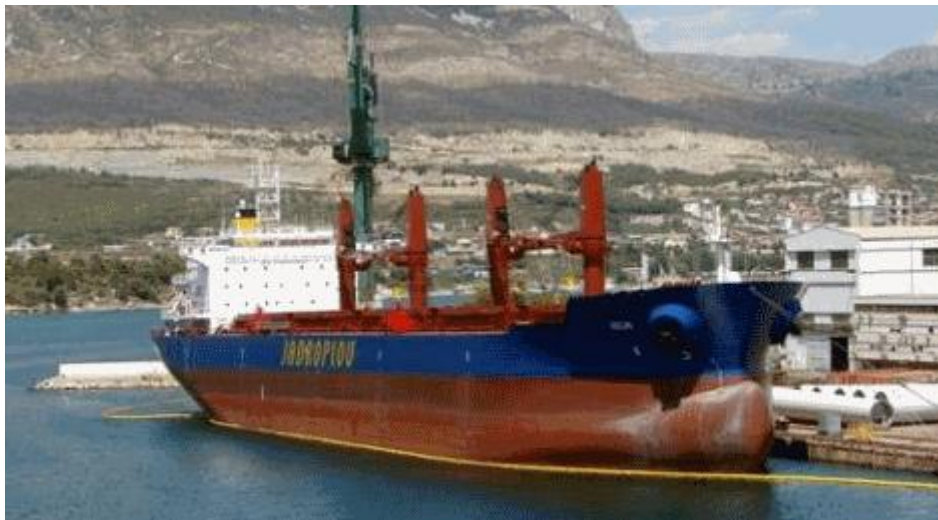
Slika 3. Brod za prijevoz rasutog tereta

Nadgrađe koje se sastoji od 4 kata i kormilarnice smješteno je na krmi, a opremljeno je za smještaj 25 osoba.