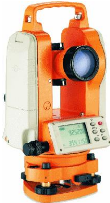
Slika 23. Teodolit

Princip rada mjernih uređaja je kontinuirano emitiranje infracrvene ili laserske zrake elektrooptičkog daljinomjera prema mjernoj točki. Nužan uvjet je da se mjerna točka vidi tj. između točke i instrumenta ne smije biti prepreka. Zraka se reflektira od mjerne točke i vraća u prijemnik na instrumentu u kojem se registrira. Nakon registracije prema faznoj razlici ulazne i izlazne zrake računa se udaljenost od točke do instrumenta.