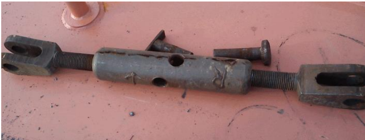
Slika 18. Mehanički pritezivač sekcije

Pošto je sekcija pozicionirana, kontrolira se njen poprečni i uzdužni nagib, te da li je pravilno centrirana, a ukoliko je potrebno sekcija se fino podešava u smjeru duljine i širine broda, mehaničkim ili hidrauličkim sredstvima.