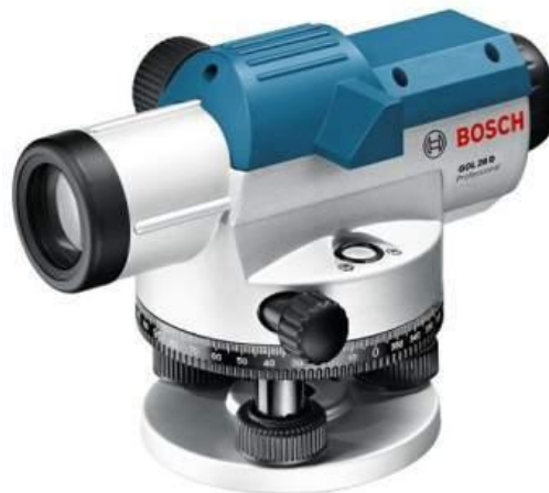
Slika 22. Nivelir