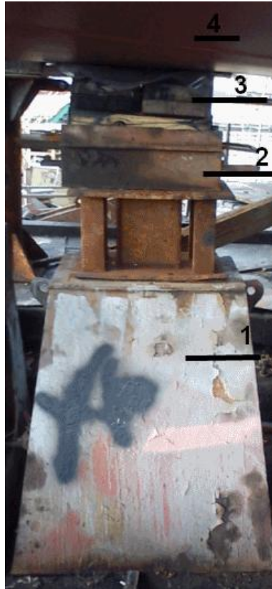
Slika 7. Pješčana potklada 1- čelična baza, 2- pješčana kutija, 3- meko drvo, 4- trup broda

Primarno, svrha pješčane kutije je prijenos opterećenja na čeličnu konstrukciju te sa čelične konstrukcije baze na sam navoz, a sekundarno, veoma brzo i efikasno rušenje potklada prije porinuća broda kako bi se brod postavio na sustav saona - saonice. Rušenje se obavlja tako da se maljem izbije metalna ploča, prikazana na slici 8, ispod pješčane potklade, koja u sebi ima rupu kroz koju procuri pijesak, te se na taj način potklada može odstraniti bez rezanja. Ušteda u vremenu, materijalu i radu.