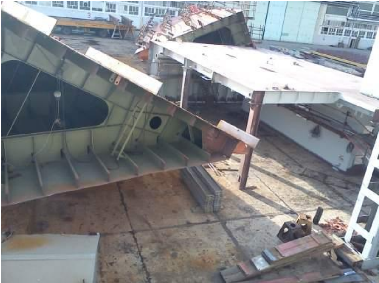
Slika 10. Sekcije potpalubnih bočnih tankova u pripremi za montažu