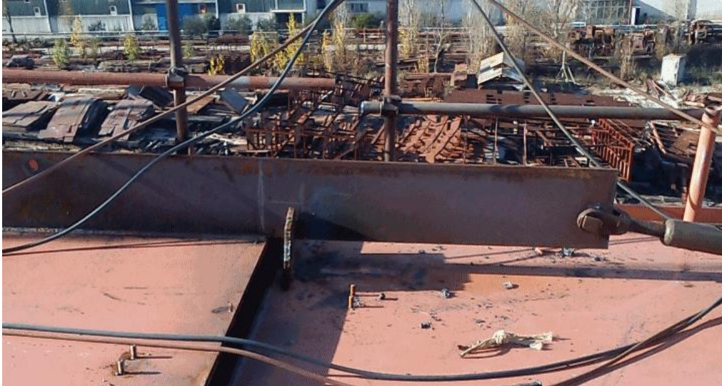
Slika 17. Traka prethodno zavarena na sekciju, služi kao pritezni element u kombinaciji sa mehaničkim pritezivačem

Jedan od alata koji se koriste pri ovom poslu je mehanički pritezivač, vidljiv na slikama 17 i 18. Jednim krakom se spoji sa sekcijom koja je već montirana, drugim na pomoćnu traku sekcije koja se montira. Nakon toga se rotacijom središnjeg elementa ostvaruje primak jedne sekcije drugoj. Također se koriste hidrauličke pumpe kad je potrebna veća sila da bi se sekcija postavila na željenu poziciju.