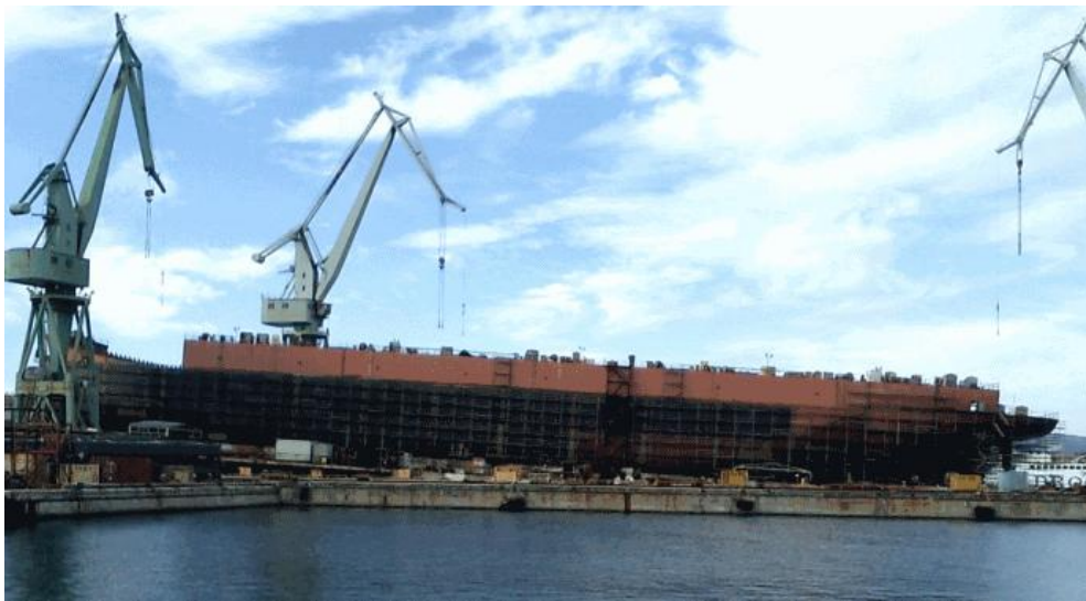
Slika 1. Brod na navozu

Montaža trupa broda na navozu, prikazana na slici 1, znači međusobno povezati ili sastaviti sekcije trupa, koje su ranije predmontirane, u jednu cjelinu, brod. Montaža trupa plovni objekata spada u jednu od ključnih tehnoloških faza u gradnji plovni objekata koja uključuje veoma opsežnu koordinaciju, stručno znanje, poštivanje tehničkih specifikacija, razumijevanje tehnološke dokumentacije te kontrolu rezultata.