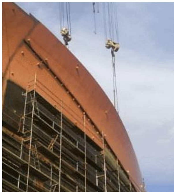
Slika 14. Sekcija se pozicionira na odgovarajuće mjesto