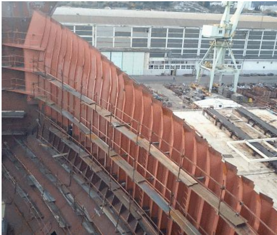
Slika 13. Mjesto na koje će se montirati sekcija wing tanka

U ovom slučaju obje 100t dizalice koje su dostupne na navozu 2 rade sinhrono te podižu sekciju na njenu lokaciju na pramcu broda, što je prikazano na slici 14. U ovoj fazi posla sudjeluju dizaličari (transport sekcije) te brodomonteri (prihvat sekcije čeličnom užadi).