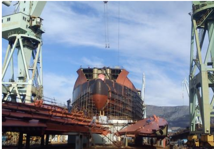
Slika 2. Sekcije potpalubnih bočnih tankova u pripremi za montažu

Prednost blokova je što nisu toliko veliki kao moduli, a i dalje uvelike mogu smanjiti broj manipulacija sekcijama. Naravno, ukoliko brodogradilište ima dovoljno široke transportne puteve, te mogućnosti dizanja na navoz.