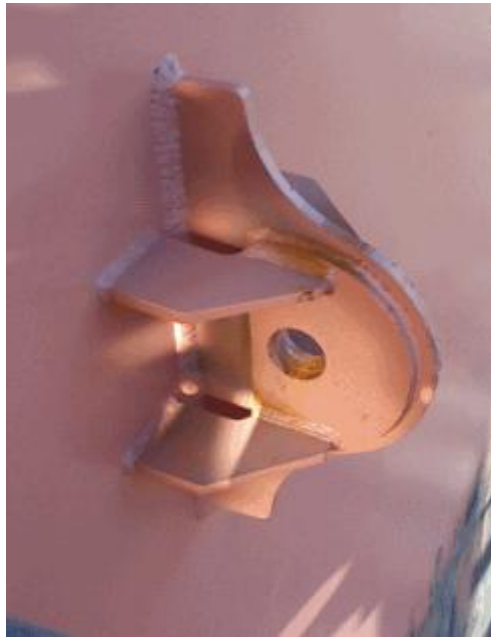
Slika 11. Uška za transport sekcije

U ovoj fazi uglavnom sudjeluju samo zavarivači, koji trebaju elemente zavariti na sekciju.