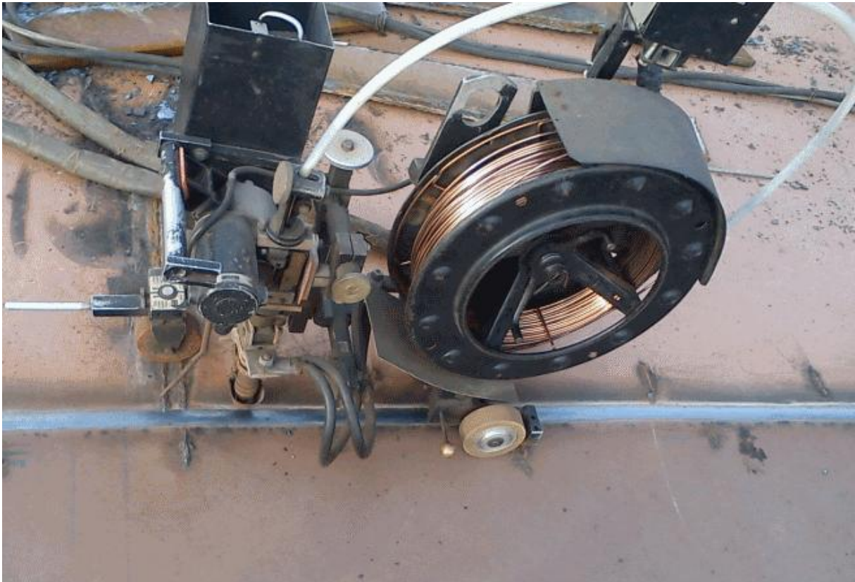
Slika 21. "Žabica" za automatsko zavarivanje

U ovome dijelu posla sudjeluju zavarivači, brusачi, rezači i ravnači.