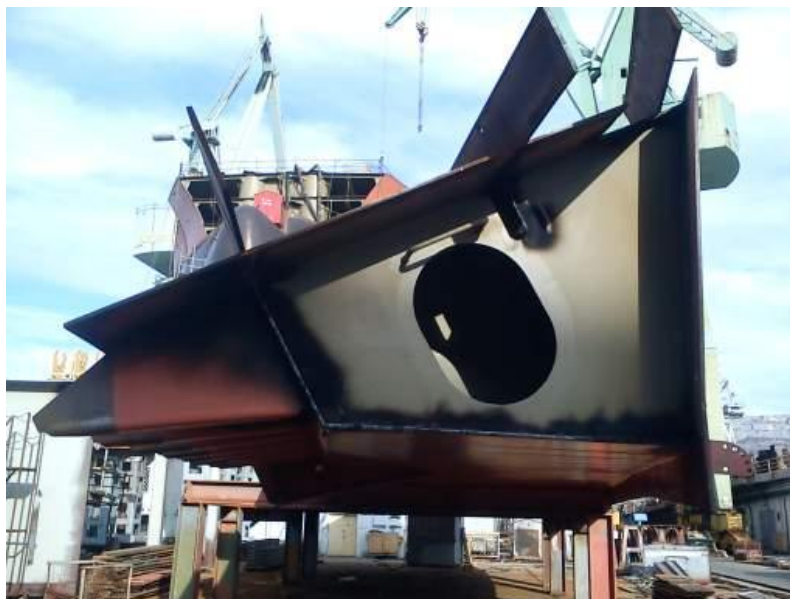
Slika 12. Sekcija potpalubnog bočnog tanka u pripremi

U ovoj fazi uglavnom sudjeluju samo zavarivači, koji trebaju elemente zavariti na sekciju.