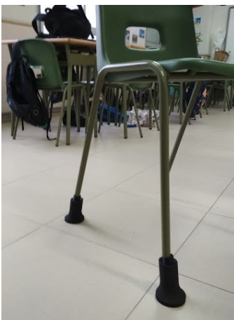
Figura 2. Silla con pieza realizada por impresión 3D

la posibilidad de utilizar mobiliario ajustable y regulable a cada estudiante (Kahya, 2019). Una vez hechas estas recomendaciones, los autores indican también que estas soluciones por lo general no serían viables por el coste que generaría a las Universidades. Debido a esta problemática, como segundo objetivo de la intervención nos propusimos buscar una solución creando un sistema que permitiera crear un mobiliario ajustable a partir del existente, pero que fuera de bajo coste. Para ello aplicamos la tecnología de impresión 3D, creando unas piezas como las mostradas en la figura 2. Las cuales se ajustan a las patas de la silla y permitirían adaptar la altura de la misma a las medidas antropométricas del alumnado. Con unas propiedades de material y diseño que garantizan la utilización de la silla en condiciones de seguridad y adaptación ergonómica.