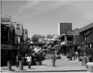
(写真2) Buchanan St.の歩行者専用通り