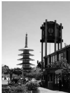
(写真1) Buchanan St. からみた日本町