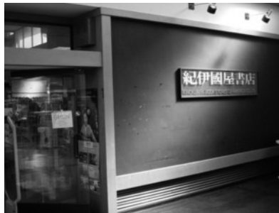
(写真5) ジャパンセンター内の紀伊國屋書店