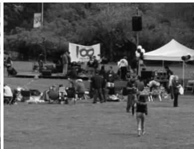
(写真10) SFJT 百周年記念シンポジウム (写真11) SFJT 百周年記念ピクニック (左:オミ准教授, 右:フクシマ氏)