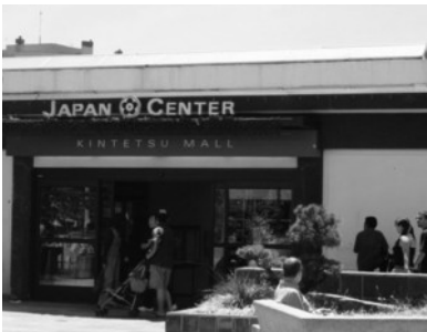
(写真4) ジャパンセンターの入り口