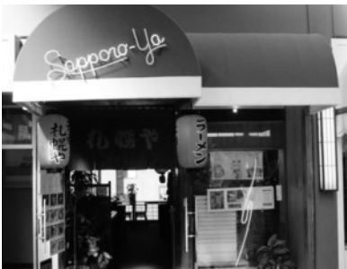
(写真6) ジャパンセンター内のラーメン屋