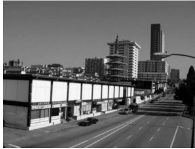
(写真3) Geary Boulevard から見た日本町