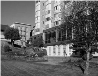
(写真8) 日本町テラスの中庭