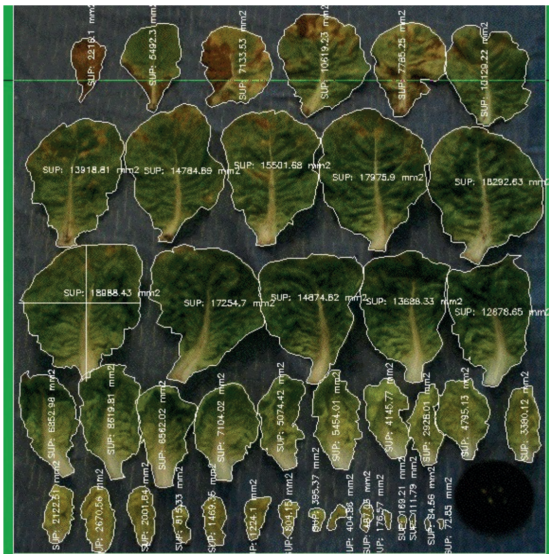
Fotografía 1. Planta representativa de la patología con 10 hojas afectadas y 14,4 dm 2 de superficie foliar afectadas. Se descartaron las tres primeras hojas.