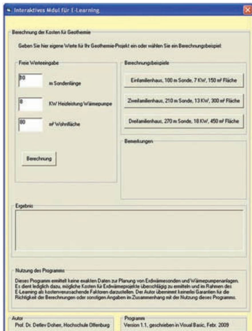
Abb. 4.4-2: Berechnungsmodul zum Kostenrahmen für Projekte der oberflächennahen Geothermie anhand von empirischen Werten. Die Berechnungsparameter wurden anhand von publizierten Daten kalkuliert (Siehe [2])

Dieses wird gerade für den privaten Bereich zur Wärmeversorgung von Wohnhäusern bei steigenden Energiepreisen immer interessanter, sodass der Kurs die Berechnungsfaktoren zur Auslegung von Erdwärmesonden bei unterschiedlichen Standortbedingungen und Heizbedarf