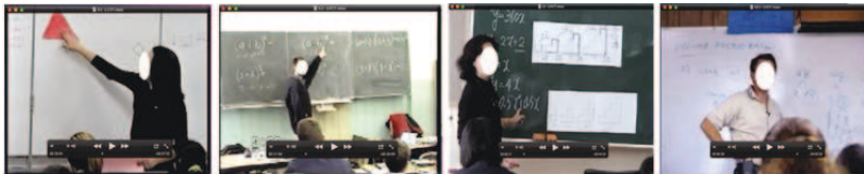
Abb. 1: Screen shots der Unterrichtssituationen in Australien, Deutschland, Japan und den USA (v.l.n.r.)