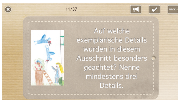
Abb. 1: Vorderseite und Rückseite einer Lernkarte

Eine digitale Lernkarte unterscheidet sich konzeptionell nicht von einer konventionellen, analogen Lernkarte auf festem Papier. Am häufigsten eingesetzt werden solche Karten zum Üben von Vokabeln. In einem Zettelkasten einsortiert, enthält eine Lernkarte in der Regel eine Aufgabe oder Frage auf der Vorderseite und die passende Antwort oder Auflösung auf der Rückseite. Genauso ist auch eine digitale Lernkarte konzipiert. Konventionelle