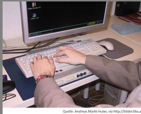
Abb. 1: Benutzung einer Braillezeile