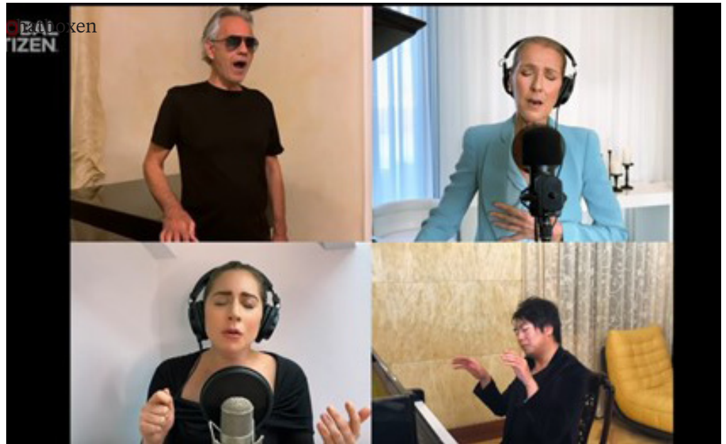
Figuur 3: Andrea Bocelli, Celine Dion, Lady Gaga en Lang Lang spelen 'The Prayer' tijdens het One World: Together at Home-evenement. Screenshot van YouTube-video, https://www.youtube.com/watch?v=SYJCYrII-Sk .

chatboxen van livestreams waarin stevast wordt uitgekeken naar het feestelijke moment dat men weer als vanouds kan samenkomen voor concerten. Wat we vooral kunnen leren uit de activiteit in chatboxen, is het belang dat wordt gehecht aan bevestiging van groepsdeelname en daarmee het delen van een ervaring. Hieruit blijkt wederom dat muziek fungeert als sociale geleider, maar dat zonder het vermogen andere deelnemers van het ritueel te zien of horen, de kans op een gedeelde collectieve ervaring miniem is.