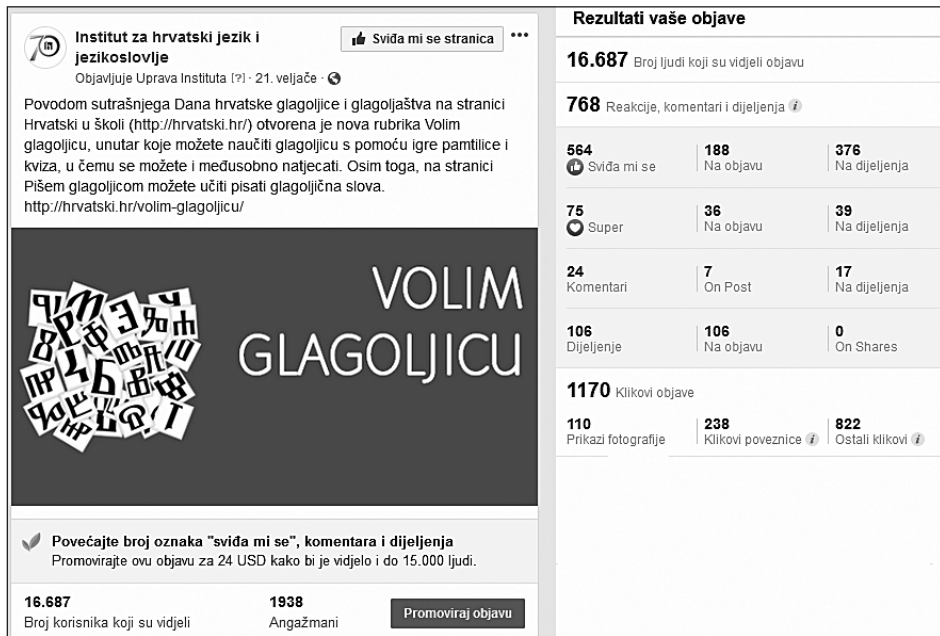
Slika 6. Statistika objave na Facebooku za igre s glagoljicom

Trenutačno iz tablice rezultata za glagoljične igre možemo vidjeti da je 1145 igrača odigralo pamtilicu te predalo rezultate, a u slučaju kvizova to su učinila 504 igrača, što također svjedoči o redovitoj posjećenosti i uspješnosti igara. U svibnju 2019. bilo je zabilježeno 758 odigranih igara za pamtilicu te 378 za kviz. Igre za učenje glagoljice objavljene su na portalu Hrvatski u školi pod rubrikom Volim glagoljicu .