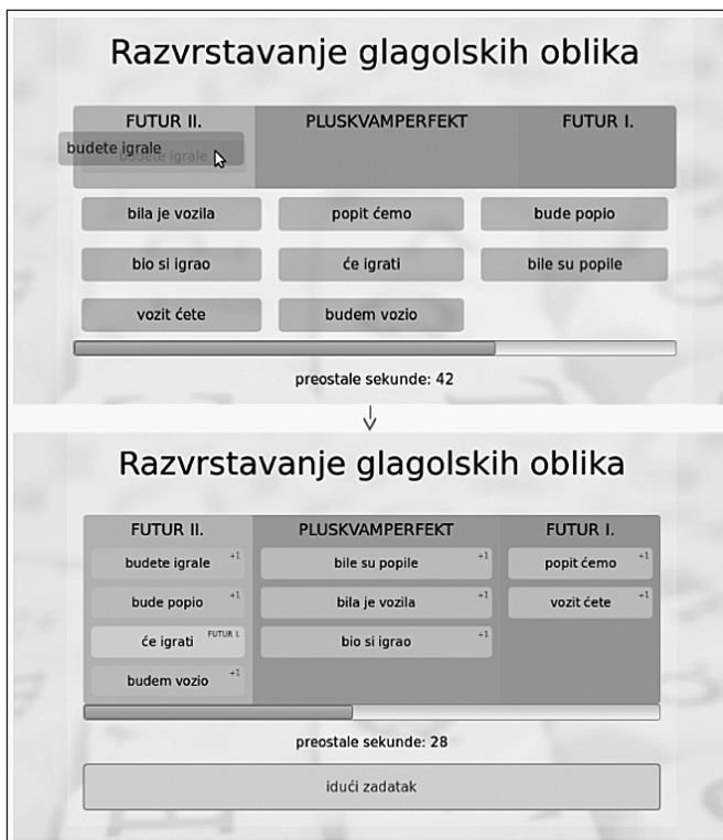
Slika 5. Način rada igre za razvrstavanje glagolskih oblika

njihovo prepoznavanje, dakle pasivno znanje. Igra trenutačno obuhvaća samo glagolska vremena (prezent, perfekt, aorist, imperfekt, pluskvamperfekt, futur I. i futur II.) te je osmišljena tako da zadane glagolske oblike treba razvrstati u polja na kojima je navedeno odgovarajuće vrijeme. U svakome zadatku prikazuju se po tri polja s odabranim glagolskim vremenima te devet izmiješanih blokova koji sadržavaju glagole u tim oblicima. Blokove je potrebno razvrstati u zadana polja, što se postiže dovlačenjem s pomoću miša ili uporabom dodirnoga zaslona. Igra je vremenski ograničena te igrači za rješavanje svakoga zadatka imaju jednu minutu. Kad se svi blokovi dovuku na neko polje, pored točno razvrstanih oblika prikažu se osvojeni bodovi, a u slučaju da je blok razvrstan u pogrešno polje, u njegovu gornjemu desnom kutu prikaže se točno glagolsko vrijeme. U igru je ugrađena tablica rezultata, pa se igrači mogu međusobno natjecati. Osim na podstranicu Mrežnika poveznica na ovu igru može se nalaziti i u podnatuknici glagolsko vrijeme natuknice vrijeme te u natuknici glagol .