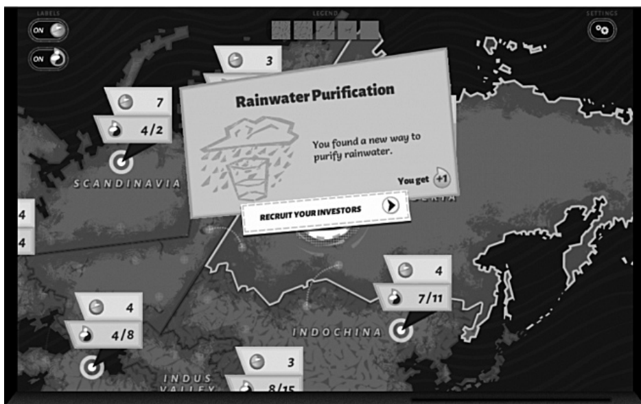
Slika 2. Prikaz odabranoga trenutka u igri Aqation: The Freshwater Access Game , u kojoj je ulaganje u istraživanje u Rusiji dovelo do otkrića nove metode za pročišćavanje kišnice

Wikipedija sadržava igre koje su povezane s njezinom uporabom. Igra The Wikipedia Adventure 10 na nekoliko razina uči igrače kako oblikovati svoje korisničke profile, urediti sadržaje na Wikipediji , stavljati citate uz izvore koje objavljuju na mreži, kako provjeriti i procijeniti valjanosti izmjena sadržaja članka koji su sastavili drugi korisnici itd. Neki rječnici i enciklopedije poput The Free Dictionary i Ancient History Encyclopedia sadržavaju vlastite mobilne aplikacije, ali većina tih aplikacija ne sadržava igre koje se nalaze na mrežnim stranicama. Za razliku od njih stranica Hrvatskoga pravopisa (Jozić i dr. 2013) nema igre, ali se pravopisni kviz nalazi na mobilnoj aplikaciji 11 . Hrvatske enciklopedije zasad nemaju ni igre ni elemente igrifikacije 12 .