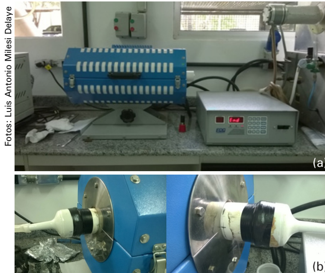
Figura 2. Forno tubular laboratorial (a) e detalhe da adaptação do forno para fluxo de N 2 (b).

Cada fornada sem fluxo de N 2 contou com duas repetições (duas navículas dispostas simetricamente no tubo de combustão) a cada temperatura. Sob fluxo de N 2 , foram feitas quatro fornadas, de modo a obter-se 8 repetições para cada biomassa (quatro fornadas). Foram medidos os rendimentos em sólidos (biochar, Tabela 1). Todas as amostras foram submetidas à análise elementar em analisador Vario Macro Cube Elementar, medindo-se as porcentagens em C, H, N e S e de O por diferença (Tabela 2). As razões atômicas H/C e O/C foram calculadas para todas as amostras, mas somente nas produzidas sob fluxo de N 2 , os cálculos foram feitos considerando a massa livre de cinzas.