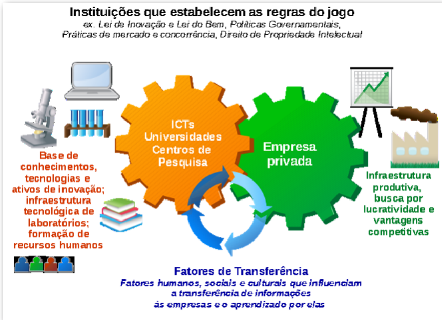
Figura 1. Interação entre ICTs e empresas privadas.

A Figura 1 apresenta os relacionamentos estabelecidos entre instituições e organizações com foco na interação entre ICTs e empresas privadas, sob uma perspectiva de inovação sistêmica.