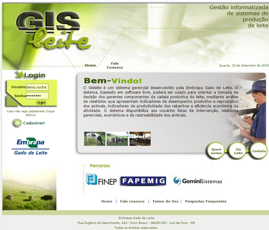
Figura 6. Tela de cadastro e acesso para uso do Gisleite.