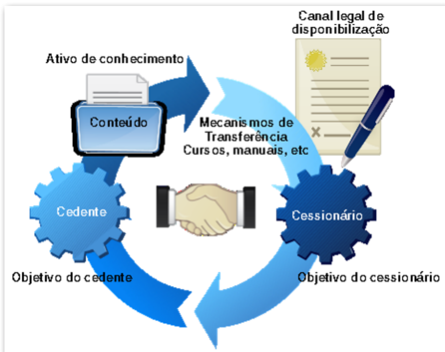
Figura 2. Processo de efetivação da Transferência de Tecnologia.