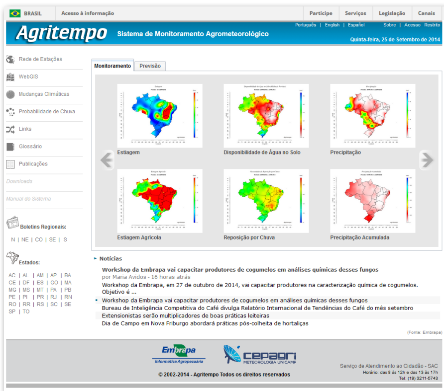
Figura 9. Tela de entrada do website do sistema Agritempo.

A Figura 9 apresenta a interface de entrada no sistema Agritempo.