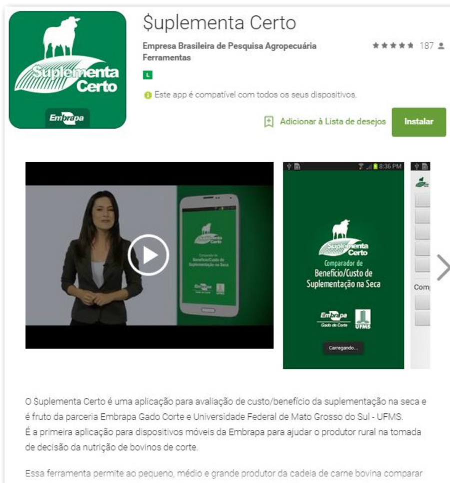
Figura 5. Página de apresentação do aplicativo Suplementa Certo .